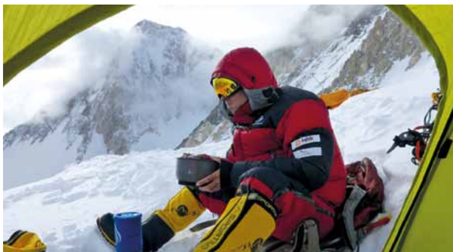
Vrchol Gasherbrumu I se nachází v pohoří Karákorám, v těsné blízkosti druhé nejvyšší hory na světě K2. Obě hory jsou od sebe vzdáleny pouze 25 kilometrů.

I přesto se jim podařilo Gasherbrum I zdolat rychleji než očekávali, radost z prvního pokoření osmitisícovky jim ale při sestupu zkalila smutná zpráva o smrti jejich kolegy Zdeňka Hrubého, který spolu s Markem Holečkem zdolával horu náročnější jihozápadní