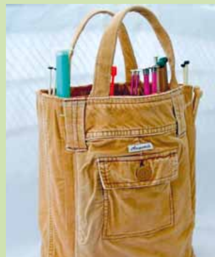
Příkladem upcylace může být tato stylová taška ušitá ze starých kalhot.