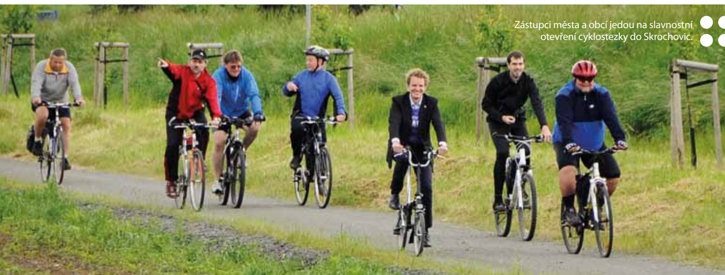
Zástupci města a obcí jedou na slavnostní otevření cyklostezky do Skrochovic.

Závěrečná jednání ministra dopravy se odehrála v Krnově. Zástupci Sdružení pro výstavbu komunikace I/11–I/57 s ním debatovali o východní části severního obchvatu Opavy. Zahájení její výstavby se předpokládá v polovině příštího roku, zprovoznění pak v roce 2017, stejně jako severovýchodní obchvat Krnova. U západní části severního obchvatu Opavy by do konce roku 2015 mělo dojít k vydání územního rozhodnutí.