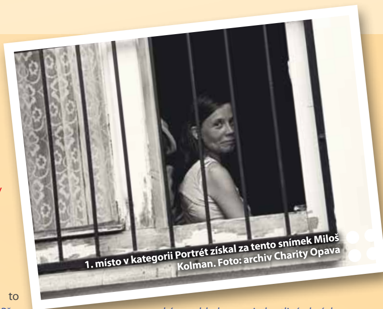
1. místo v kategorii Portrét získal za tento snímek Miloš Kolman.

Porotci na základě anonymního hodnocení vybrali v každé kategorii tři nejzdařilejší fotografie a udělili jednu zvláštní cenu. Všichni ocenění obdrží pozvání na slavnostní vernisáž, která se uskuteční 25. března v 19 hodin v Historické výstavní budově Slezského zemského muzea. Vítězům zde budou předány diplomy a ceny. Výstava potrvá od 26. března do 7. dubna. Poté bude putovat po městech České republiky.