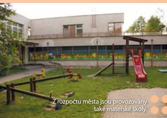
Z rozpočtu města jsou provozovány také mateřské školy.

s příjmy okolo 68 milionů korun. „ Rozpočet je vyrovnaný, ale jsou do něj zapojeny prostředky z úvěrů a zůstatky z minulých let. Myslím, že je to rozpočet, který dává naději pro plně fungující město, počítá s velmi seriózním přístupem k umožování úvěrů. Podle mého soudu je rozpočet konzervativní a dobrý, “ uzavírá primátor Zdeněk Jirásek. Úvěry má Opava v tuto chvíli čtyři, k 31. 12. 2012 v celkové výši 670 milionů korun. Pravidelné splátky úvěrů v příštím roce budou činit 64,5 milionu korun a dle přijatých dotací jsou prováděny mimořádné splátky (v loňském roce 24,1 milionu, pro tento rok jsou již avizovány ve výši 46 milionů korun).