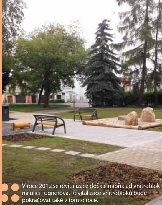
V roce 2012 se revitalizace dočkal například vnitroblok na ulici Fügnerova. Revitalizace vnitrobloků bude pokračovat také v tomto roce.

roce počítá s tím, že by mohla získat na daních 560 milionů korun. Společně s dalšími poplatky, jako jsou například poplatky za svoz odpadu, psy nebo hrací automaty, se pak příjem vyšplhá na 717,5 milionu korun. Nezanedbatelnou položkou na straně příjmů jsou pak také nájmy městských bytů a dalších objektů nebo prodej městského majetku. Letošní rozpočet v této oblasti počítá