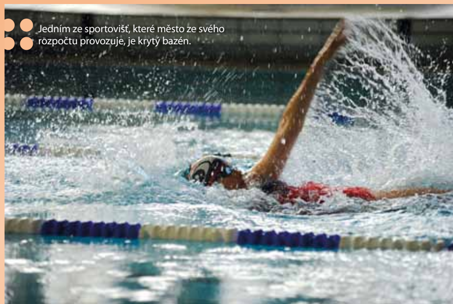
Jedním ze sportovišť, které město ze svého rozpočtu provozuje, je krytý bazén.

v tak důležitých a v našem městě dlouhodobě podfinancovaných oblastí, jako je školství a sociální oblast. Částka určená pro financování sociálních služeb je v tomto roce 15,6 milionu korun, což je o 3,3 miliony více než v roce 2010 a pro školství je v rozpočtu vyhrazeno 70 milionů korun, což je oproti roku 2010 o 8 milionů více, “ komentuje rozpočet první náměstkyně primátora Pavla Brady.