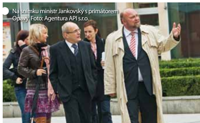
Na snímku ministr Jankovský s primátorem Opavy.