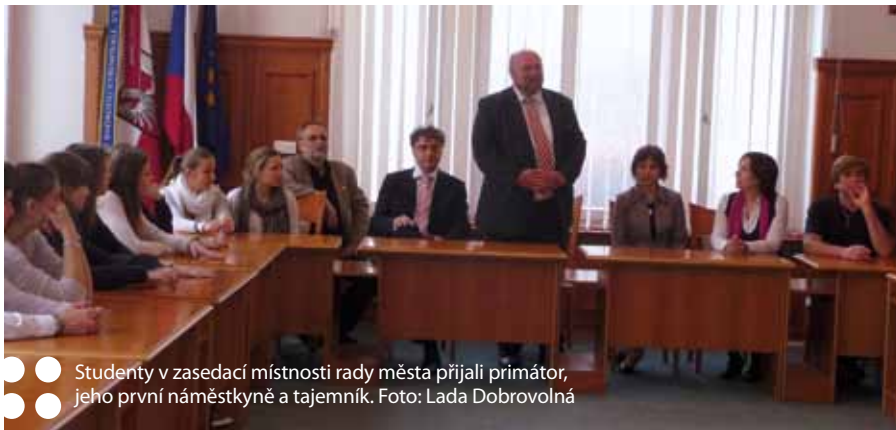
Studenti v zasedací místnosti rady města přijali primátor, jeho první náměstkyně a tajemník.

Vedení města Opavy přijalo v pátek 1. dubna na opavské radnici skupinu 20 studentů z katolického gymnázia FANB z Monackého knížectví.