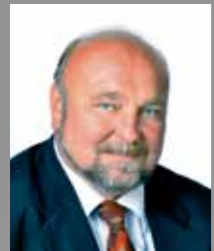
Jirásek Zdeněk primátor statutárního města Opavy