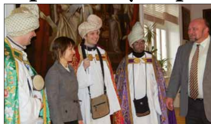
Tři králové z opavské Charity navštívili také primátora a jeho náměstkyni.

Bezprostředně po ukončení Tříkrálové sbírky nastane mírné napětí. Především koledníci netrpělivě čekají na informaci, kolik se jim zase podařilo vybrat. Sami to totiž netuší.