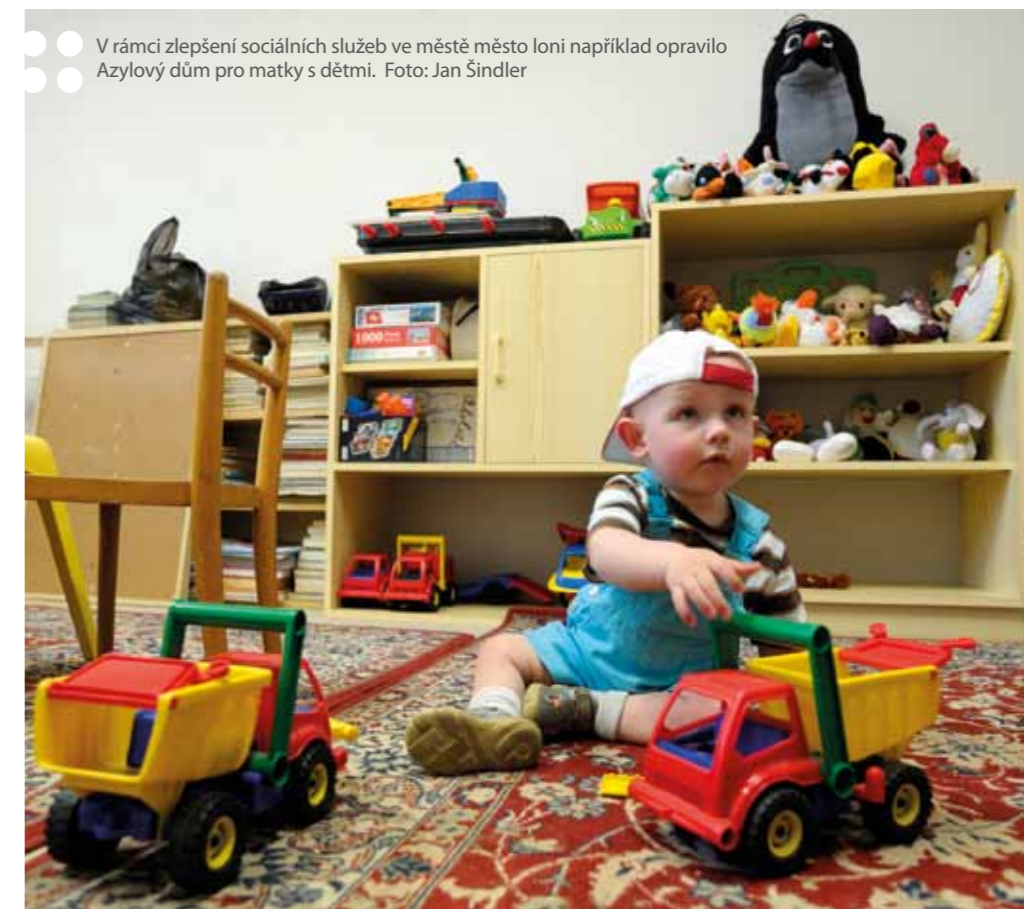
V rámci zlepšení sociálních služeb ve městě město loni například opravilo Azylový dům pro matky s dětmi.