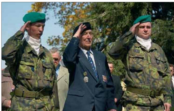
Pocta válečným hrdinům. Desítky lidí přišli vzdát hold hrdinům osvobození Opavy.