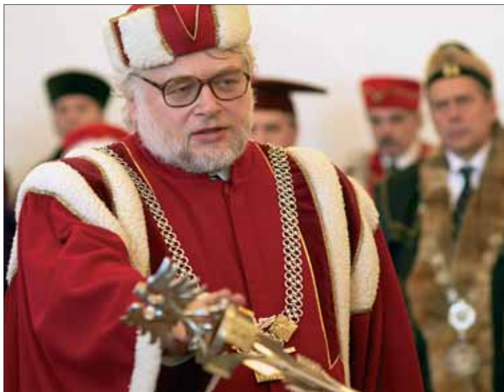
Rudolf Žáček při rektorské přísaze.

Rektor Žáček začínal vědeckou kariéru ve frýdecko-místeckém vlastivědném muzeu. V Opavě začal pracovat v roce 1989, a to jako vědecký pracovník Slezského ústavu. V roce 1991 se stal šéfem ústavu a začal přednášet na Slezské univerzitě. V roce 2001 se stal prorektorem SU pro studijní a sociální záležitosti.