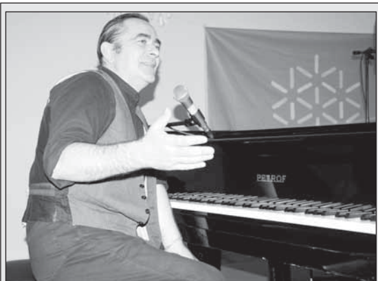
Koncert francouzského zpěváka Frederica Fortese s kapelou patřil k nejzajímavějším listopadovým koncertům v Opavě. Výjimečný francouzský zpěvák a hudební skladatel zpívá se svou kapelou písně v jazyce „Oc“ (okcitanšsky), v jazyce téměř zapomenutém, ale kdysi známém z dob trubadúrů. Koncert proběhl ve Sněmovním sále minoritského kláštera.