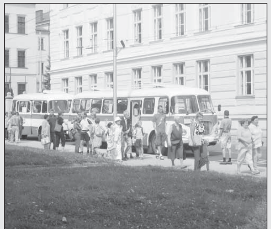
Snímek ze Dnů evropského dědictví v Opavě.

vedoucí odboru prezentace a zahraničních vztahů města