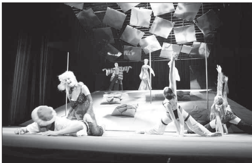
Motýlí scéna ze hry Ze života hmyzu .