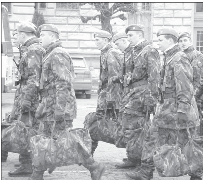
Vojáci na odchodu. Jedna velká kapitola opavské vojenské historie končí.