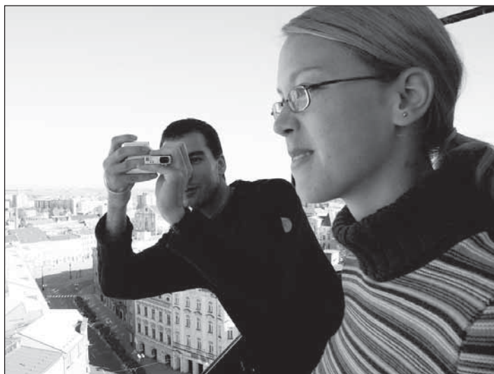
Ochoz Hlásky byl přeplněn fotoaparáty. Spouště byly v permanentním provozu.