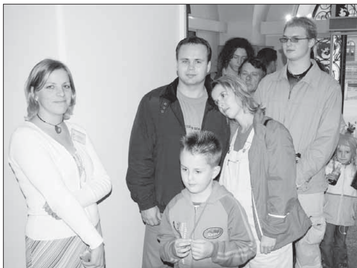
O prohlídku Hlásky byl velký zájem. U vchodu se neustále shlukovaly desítky lidí a volně vstupenky na prohlídku byly rychle pryč (za vstupenky se neplatilo, ale byly rozdávány zdarma v Městském informačním centru).