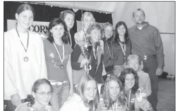
Vítězné družstvo Slezského gymnázia.