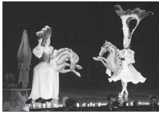
Bezručova Opava: Ensemble Damian provedl pozoruhodnou verzi barokní opery Yta Innocens.