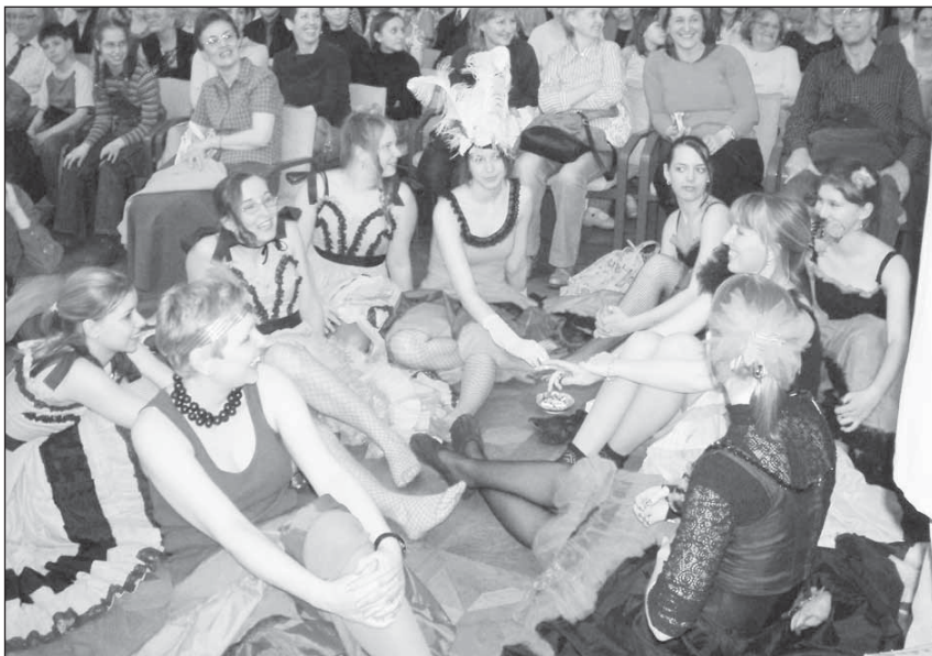
Další břehy: odpočívající tanečnice kankánu na akci „Montmartre v Opavě“.

Tradiční Evropský svátek hudby měl letos v červnu třídenní podobu – rockovou, folklorní a „Werichovskou“. V hudební oblasti město Opava i nadále podporuje existenci a dlouholetou tradici abonentních koncertů