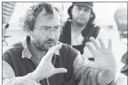
Jedna z neznámějších fotografií Bohdana Slámy z natáčení filmu Štěstí.