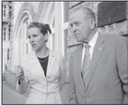
Americký velvyslanec v Opavě