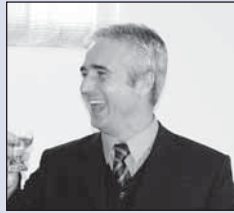
Křest knihy 100 let městské dopravy v Opavě