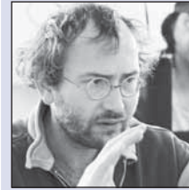
Celosvětový úspěch filmu Štěstí