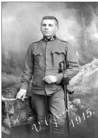
Četař aspir. a praporčík opavského 15. zeměbrance pluku, 1915.