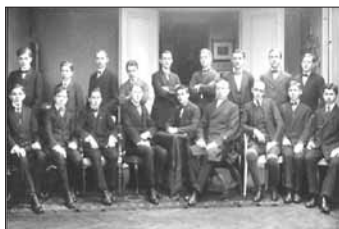
S maturanty českého gymnázia v Opavě, 1916 (stojící, čtvrtý zprava).