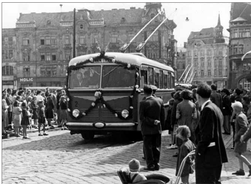
Slavnostní zahájení trolejbusové dopravy v Opavě 24. srpna 1952.