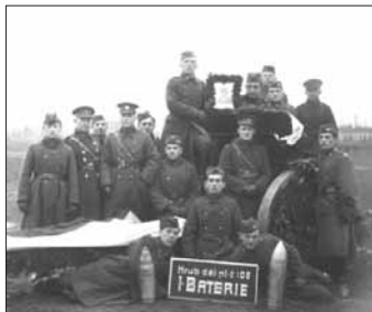
Po přísaze opavského děl. pluku 108, s vlajkou a obrazem TGM, 1921.