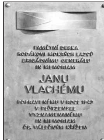
Také pamětní deska před lazeckou školou od r. 1985 připomíná rodáka.