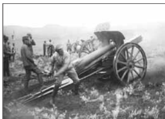
U 12 cm houfnice čsl. legionářů před sibiřským Krasnojarskem, 1919.