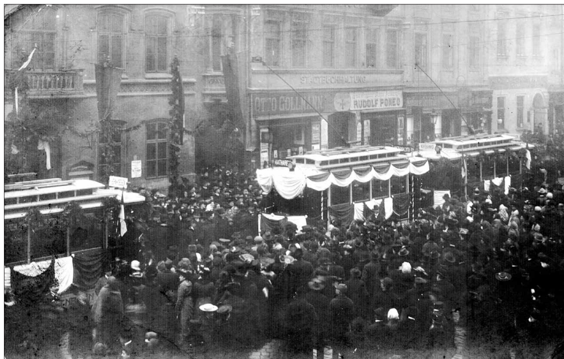
Slavnostní shromáždění před opavskou radnicí u příležitosti zahájení provozu pouliční dráhy 4. prosince 1905.

Jako důstojnou příležitost tak významného jubilea se MDPO rozhodl uspořádat ve dnech 21. až 23. října sérii akcí, jejichž součástí bude mimo jiné prezentace nové knihy mapující historii opavské městské dopravy, obdobně zaměřená výstava, dny otevřených dveří nebo jízda historickými vozidly.