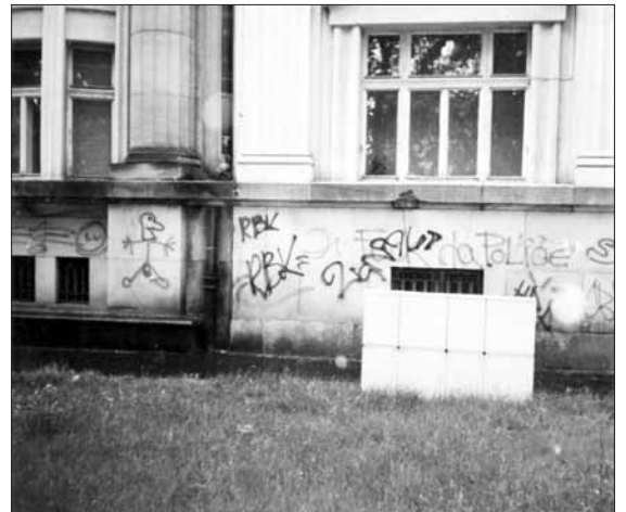
Co všechno dokáží sprejeri, vidíme i na této fotografii.

Probační úředník již v právním řízení, ale i v řízení vykonávacím, nabízí poškozeným možnost využití péče psychologů, spočívající vedle terapií také v psychologickém