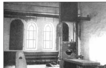
Popraviště 13 členů Obrany národa v Berlíně-Plötzensee, 23. 3. 1943.