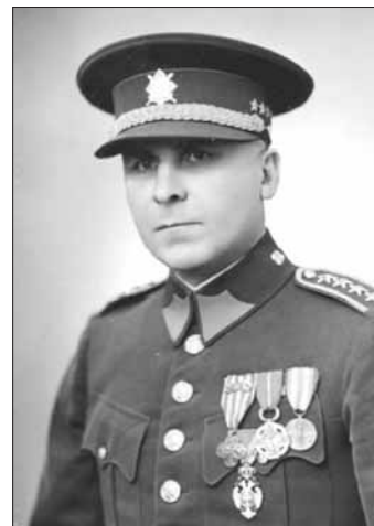
Velitel dělostřeleckého pluku v Plzni.