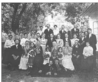
Na svatbě starší sestry v Mokrych Lazcích, 1909 (druhá řada, 2. zleva).