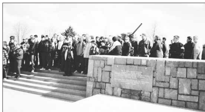
Zájezd studentů opavských a ratibořských škol do Sudic.