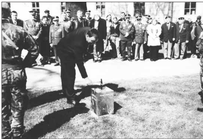
Poklep primátora Opavy na základní kámen Památníku vítězství.