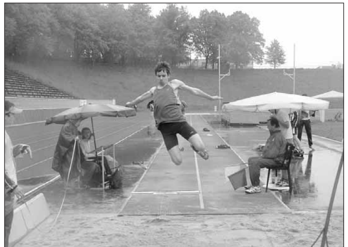
I přes nepřízeň počasí se Opavsko - ratibořský den vydařil.