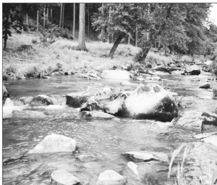
Zda budeme v přírodě nacházet podobná místa jako na fotografii, záleží jen na nás.