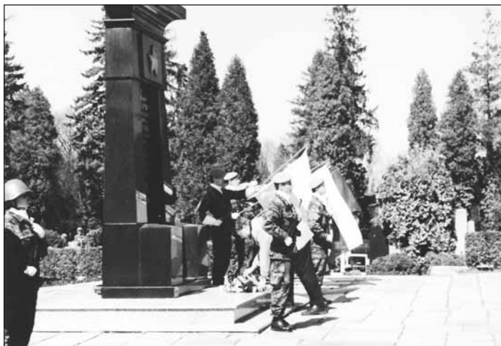
Pocta padlým rudoarmějcům na Městském hřbitově.