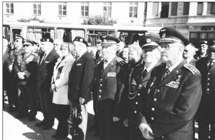
Elita československého letectva poprvé v Opavě.