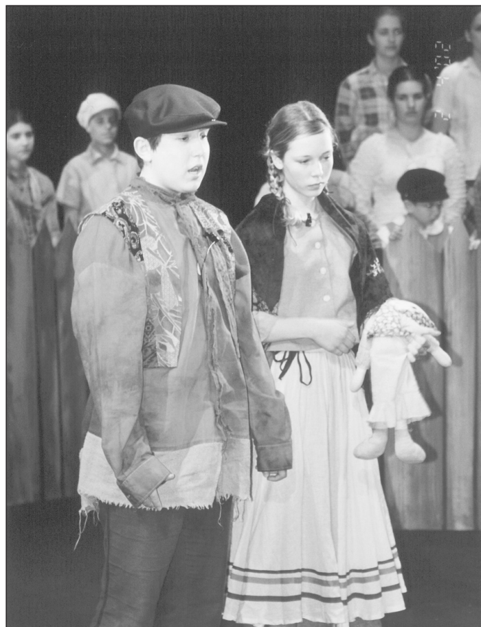
Snímek z premiéry Brundibára ve Slezském divadle v roce 2002.