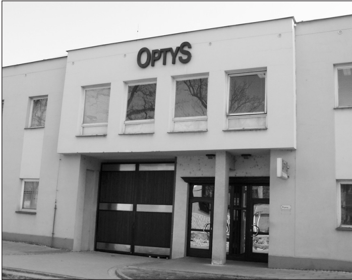
Tiskárna Optys, zde dochází ke grafickému zpracování a tisku Hlásky.