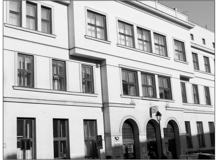
Česká pošta zajišťuje distribuci Hlásky do všech domácností v Opavě.

máhá dotvářet vzhled Hlásky. Opavská Česká pošta roznášela Hlásku od jejího prvního čísla do května roku 2003. Po vyhlášení nového výběrového řízení na distributora nebyla opětovně vybrána. Přesto od září 2003 začala Hlásku opět roznášet. Důvodem byla nespokojenost s distributorskou firmou a mnozí se stížnosti na nedodání zpravodaje. Hláška je neustále roznášena zdarma do všech vašich domácností, dnes již v dopoledních hodinách poštovními doručovatelkami. Naš