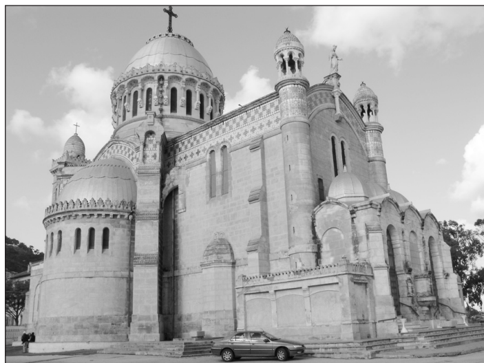
Bazilika Notre-Dame d' Afrique v Alžírsku.