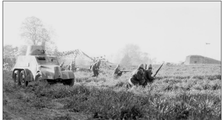
Z ukázky obrany čs. opevnění v Opavě-Milostovicích 28. 10. 2003.