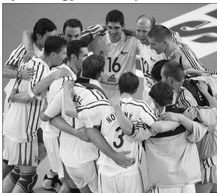
Reprezentanti českého týmu po utkání.