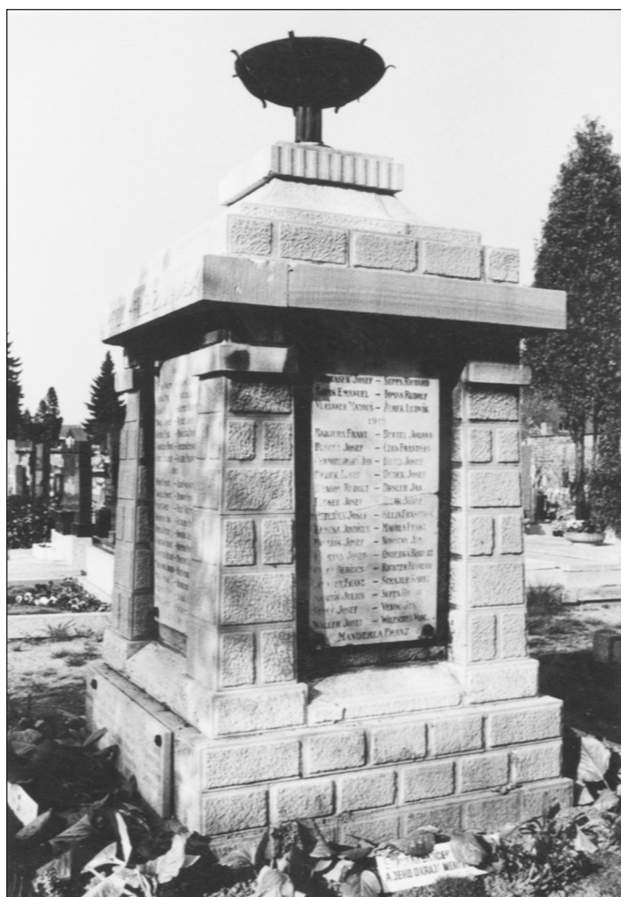
Pomník obětem I. světové války na hřbitově v Opavě-Kateřinkách.