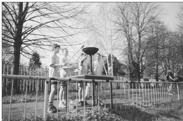
Zapalování olympijského ohně na Tyršově stadionu v Opavě.