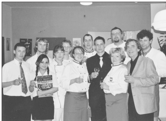
Zástupci české a slovinské školy na společné fotografii.