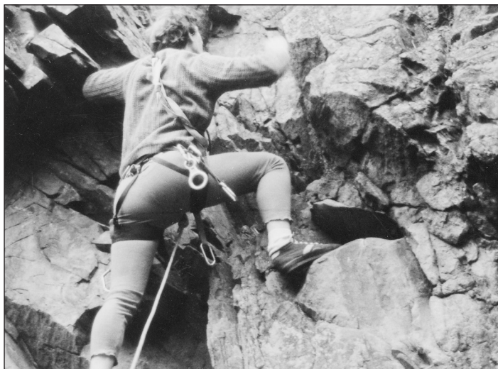
Sport osvěží nejen tělo, ale i duši.