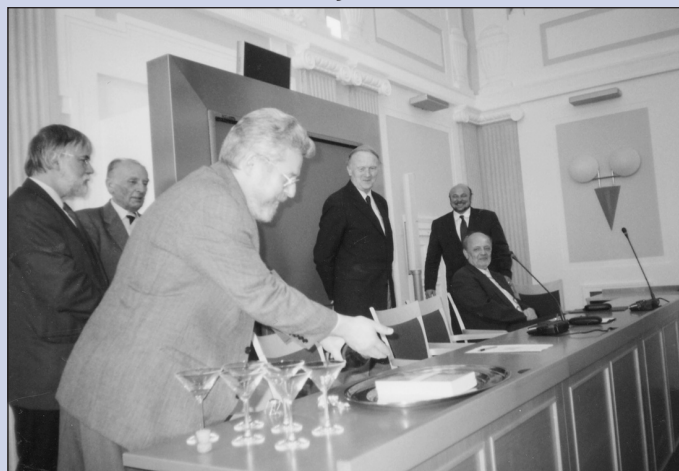
Záběr ze slavnostního křestu knihy.