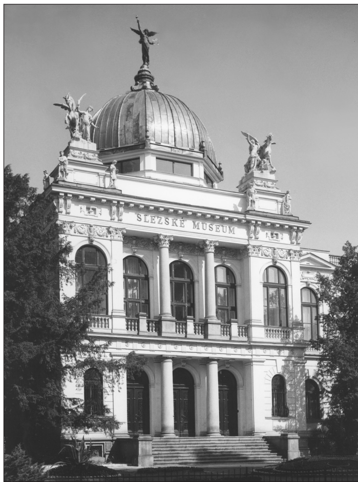
Výstavní budova Slezského zemského muzea v Opavě. Snímek pořízen v roce 1984.