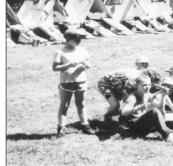
Letní tábory jsou u dětí stále v oblibě.

2.–11. 8. 2004, 8–13 let, 2 650 Kč Letní tábor na Podhradí. Rod Pánů z Vikštejna je obestřen celou řadou pověstí a bájí. Vydejme se společně proti proudu času a odhalme jejich největší a nejtemnější tajemství.