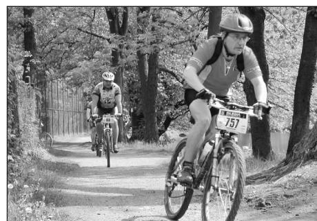
Ilustrační snímek z loňského ročníku.