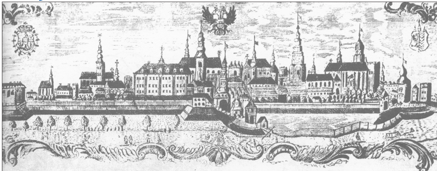
Mědirytina veduty města Opavy J. M. Langerera z šedesátých let 18. století na cestovním tovaryšském listě.

Letos oslavíme 780. výročí udělení významných privilegií městu Opavě. Připomeňme si znovu na prahu jubilejního roku o jakou udá-