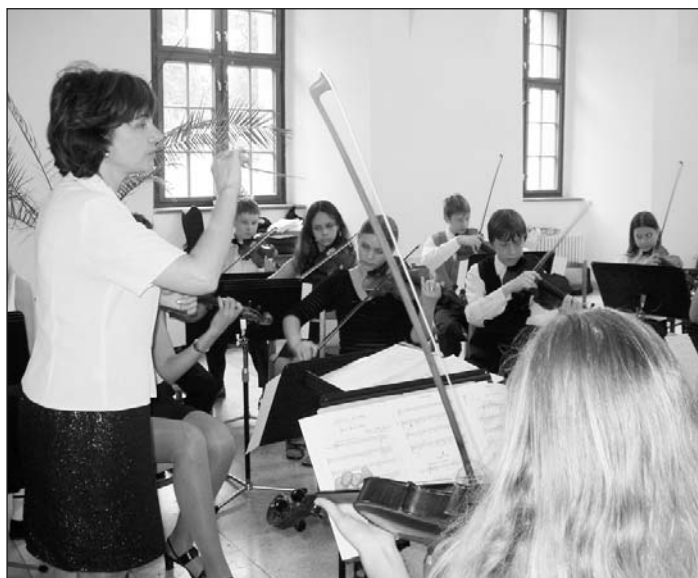
Snímek z červnového vystoupení na koncertě souborů v Minoritském klášteře k 80. výročí ZUŠ V. Kálíka.