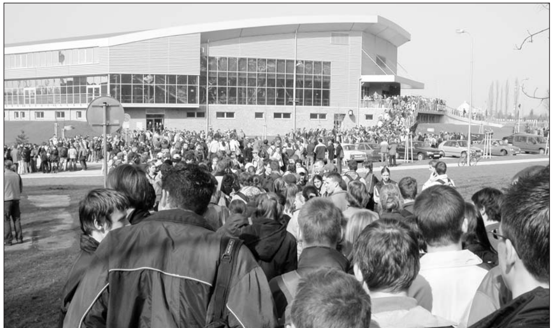
Na snímku víceúčelová hala v Městských sadech v Opavě.