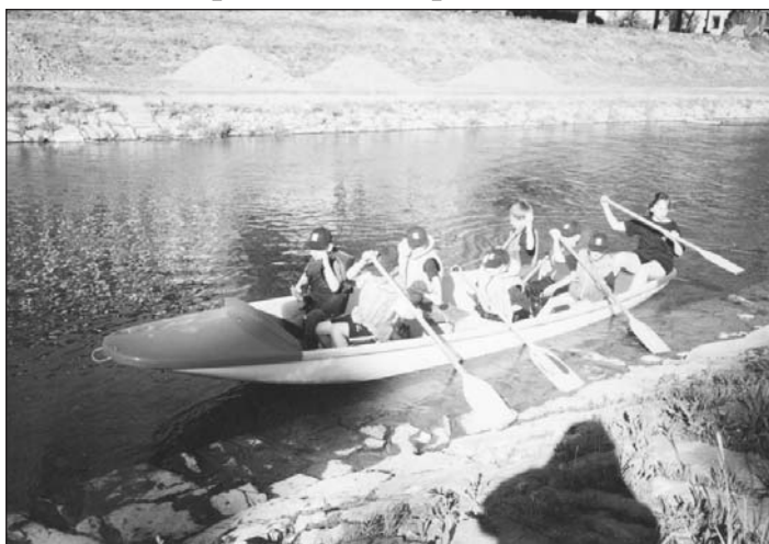
Opavští vodní skauti při tréninku.