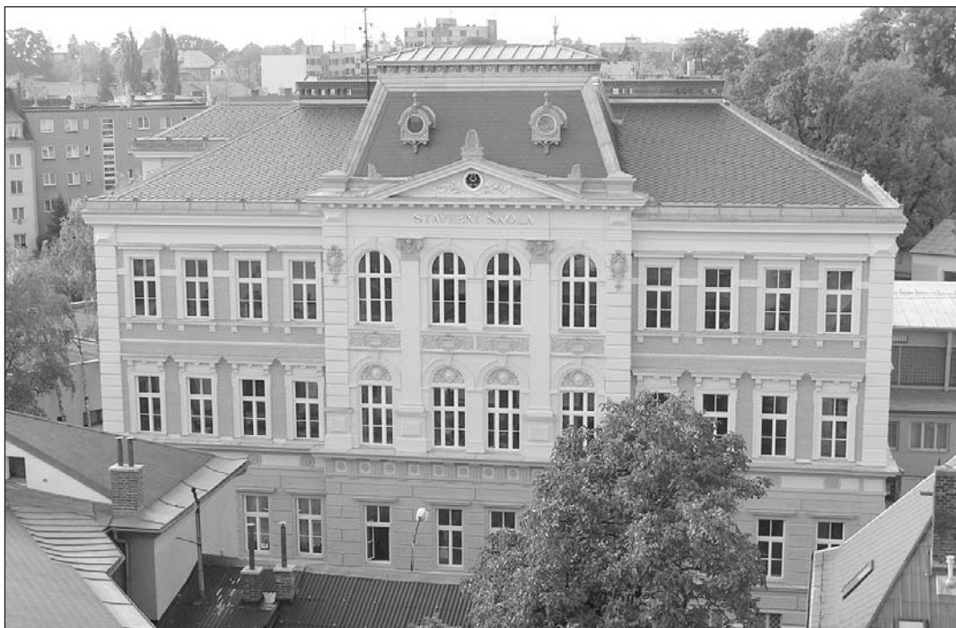
Pohled na uliční průčelí po rekonstrukci, říjen 2004.