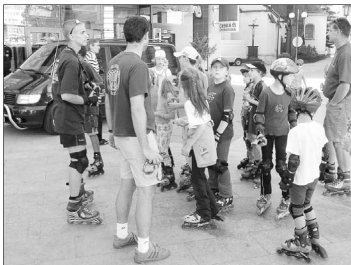
Bezpečnost soutěžících dětí do 10 let v závodě Slezská bruslička si pořadatelé opravdu hlídali. Vybavení přilbou, chrániči zápěstí, loktů a kolen proto nikomu neodpustili.

Zatímco pro nejmladší kategorii byl závod vypsan na jedno kolo, starší bruslaři museli po celé délce