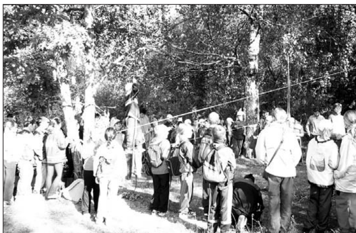
Pracovníci Stanice mladých turistů a přírodovědců v Opavě připravili pro děti lanovou lávku.