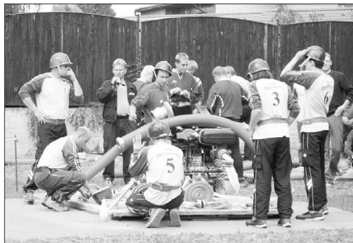
Příprava domácího týmu před startem.