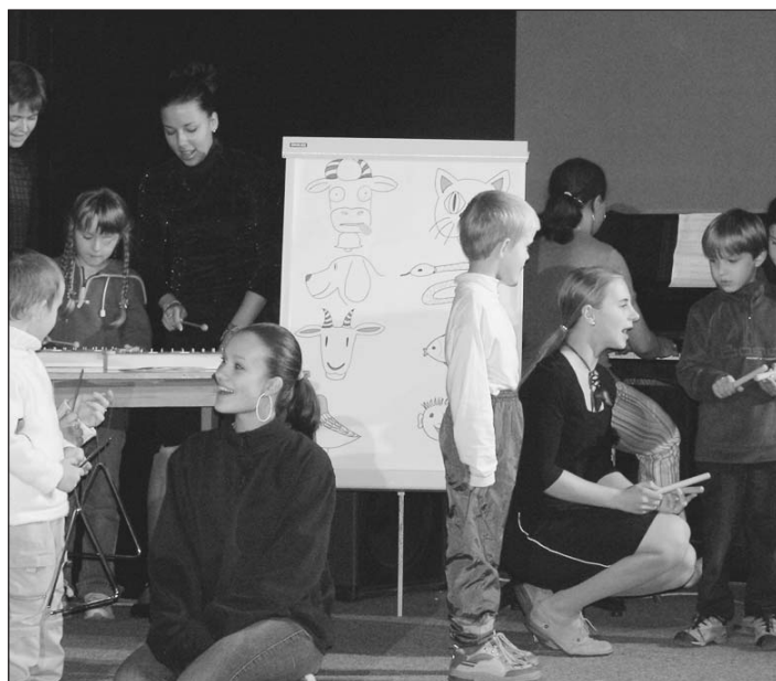
Děti si společně se studenty zahrály a zazpívaly.