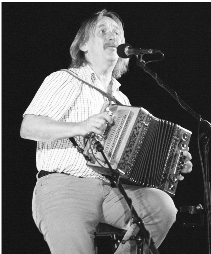
OPAVA LITERÁRNÍ. Vystoupení Jaromíra Nohavici „Tobě Opavo“.