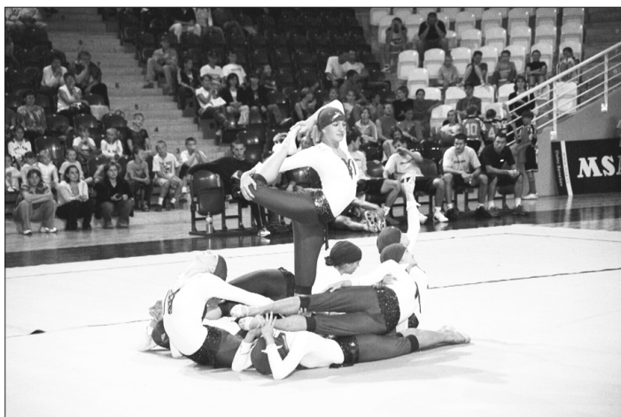
OPAVA SPORTOVNÍ. Program Galavečera opavského sportu byl velmi atraktivní.