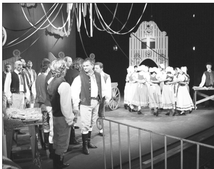
OPAVA DIVADELNÍ. Představení Prodané nevěsty ve Slezském divadle.