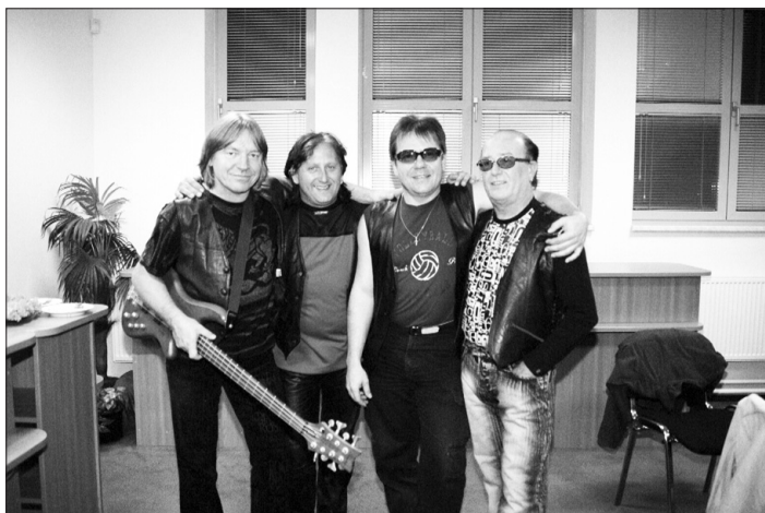
OPAVA HUDEBNÍ. Legendární skupina Olympic vystoupila ve vyprodané víceúčelové hale.