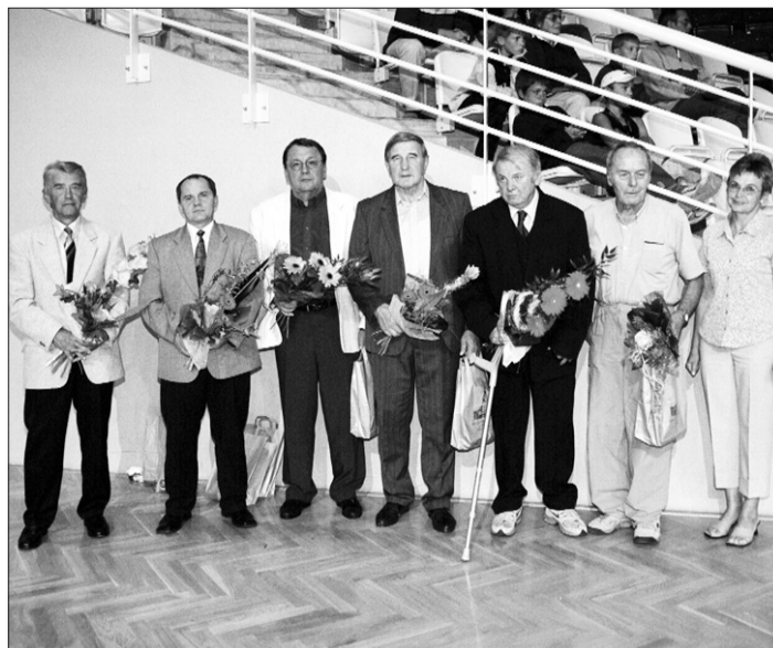
OPAVA SPORTOVNÍ. Významné osobnosti opavského sportu byly primátorem oceněny na Galavečeru opavského sportu ve víceúčelové hale.