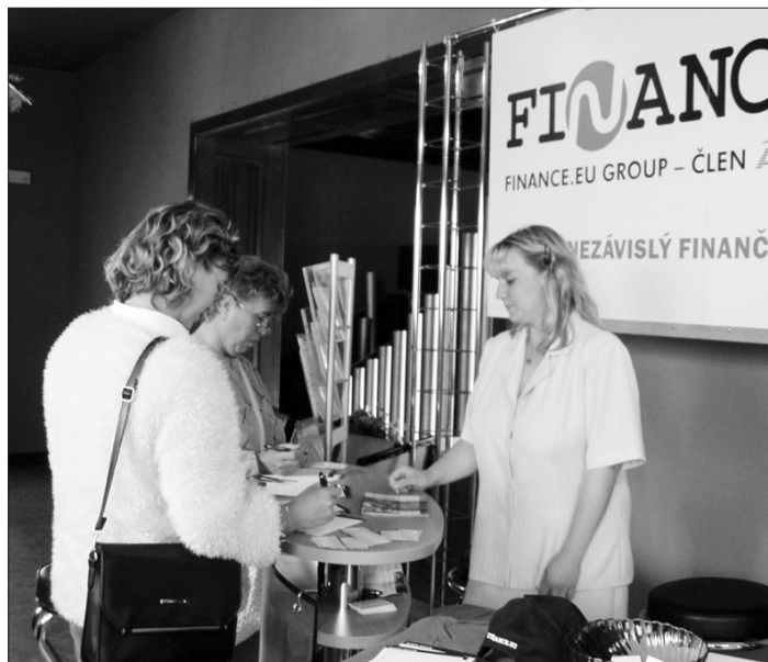
OPAVA PODNIKATELSKÁ. Městský dům kultury Petra Bezruče se stal přehlídkou mnoha firem, které působí v Opavě a okolí.