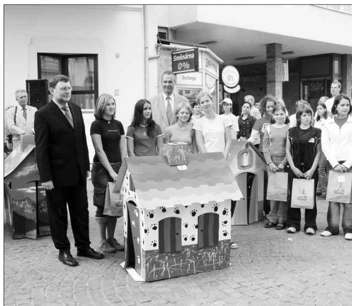
OPAVA VÝTVARNÁ. Vítězný dům soutěže a jeho tvůrce.