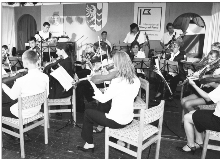
DEN PARTNERSKÝCH MĚST. Převážná část programu tohoto dne proběhla na Horním náměstí.