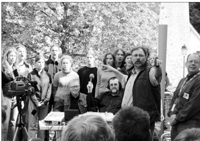
Pěvecký sbor Luscinia při živém vysílání pro RTL.