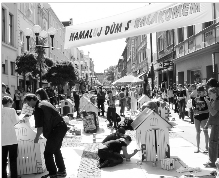
OPAVA VÝTVARNÁ. Akce Namaluj dům s Balakomem se setkala s velkým zájmem.