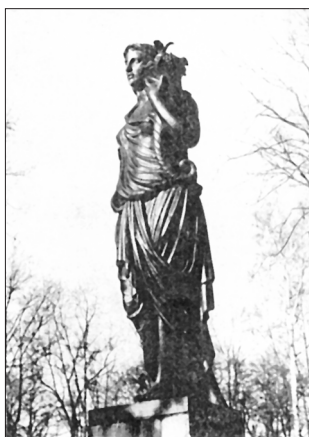
Socha bohyně Ceres v městských sadech z poloviny 19. století.