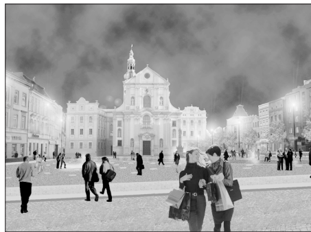
Vítězný návrh na úpravu Dolního náměstí Ing. arch. Josefa Panny.

Mariana žila. Po zrušení kašny byla socha převezena do tiché zelené městských sadů, jejichž ozdobou je po boku kamenných druhů – sochy vládců moří boha Neptuna a Aurory – dodnes.