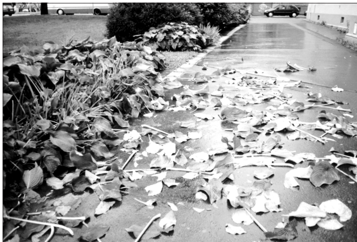
Poškození výsadby před Zemským archivem

Marně si kladu otázku, co vede tyto kazisvěty k tomuto počínání. Závist? Předvádění se? Nenávist? Znuděnost? Neúcta k práci druhých?