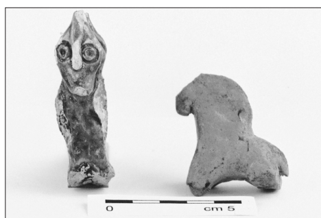
Keramické figurky (14. stol.) z Pekařské ul. č. 11

Mgr. Michal Zezula, Bc. Marek Kiecoň Státní památkový ústav v Ostravě, archeologické oddělení Opava