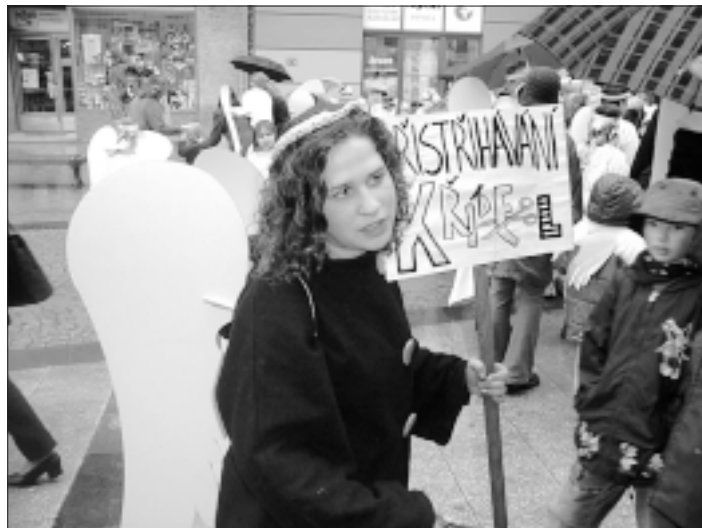
VI. ročník festivalu divadla, filmu, hudby a poezie Další břehy byl od 11.–19. dubna letos zasvěcen andělům. Na Ptačím vrchu a na Horním náměstí proběhl v pátek 12. dubna 1. celookresní slet andělů.