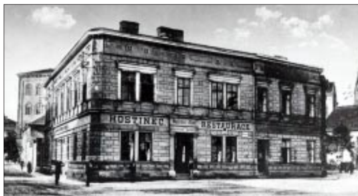
Matiční dům - sídlo Matice opavské na Rybím trhu

rům od zámožných měšťanů a šlechty, od roku 1859 i díky právu povinného tisku z oblasti rakouského Slezska. Nejprve byla umístěna spolu s muzeem v několika místnostech zemského domu (bývalé jezuitské koleje), poté v jezuitské kapli a roku 1854 byla přestěhována do budovy minoritského kláštera na Panské (dnes Masarykově) ulici. Třebaže po celou dobu existence gymnaziální knihovny ji širší veřejnost příliš neznala a nemohla ji ani plně využívat, byla neobyčejně bohatou vědeckou institucí. Takže když v poslední etapě bojů o město v dubnu 1945 zcela vyhořela a více než 100 000 svazků knih bylo zničeno, znamenalo to jednu z nejtěžších kulturních ztrát pro Opavu. Jakousi pokračovatelkou této první vědecké knihovny ve Slezsku se stala roku 1945 Slezská studijní knihovna, dnes Slezský ústav Slezského zemského muzea. Od roku 1900 existovala v Opavě německá lidová knihovna (Tropauer Volksbibliothek), která získala 15. ledna 1921 statut městské knihovny (Gemeindebücherei, resp. Deutsche Stadtbücherei). Sídliila na Rybím trhu č. 4 v 1. poschodí budovy dnešního divadelního klubu. Roku 1930 čítala 35 000 svazků. Čtenáři zde měli k dispozici čtenářský a přednáškový sál pro 200 osob s příruční knihovnou a 100 časopisy. K dispozici byla opavským čtenářům dále knihovna a čítárna Muzea pro umění a průmysl (Slezského zemského muzea) na Komenského ulici č. 10.