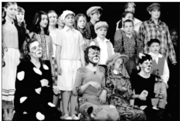
Opera Brundibár v provedení dětí z pěveckých sborů Sluníčka, Cvrčci a Domino ze Základní školy Ilji Hurníka.