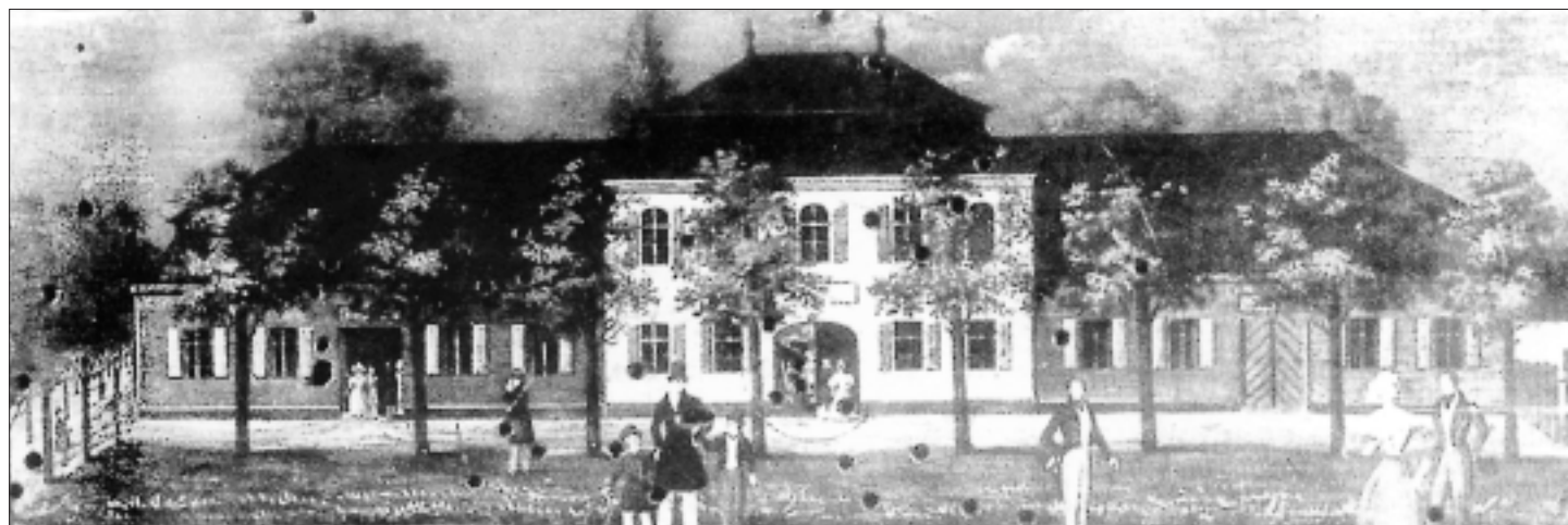
Budova městské střelnice vymalovaná na střeleckém terči z roku 1836.