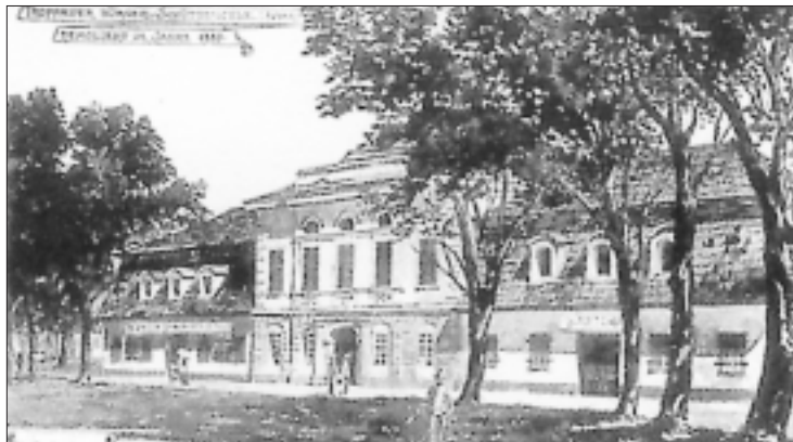
Budova střelnice před úpravou v roce 1887, akvarel M. Hartela.

V pevně organizované společnosti, v jejímž programu bylo podle kronikáře „cvičení střelby na terče a posilování patriotického a měšťanského vědomí pospolitosti“, šlo o pěstování nákladné zábavy zámožných Opavanů. V čele společnosti stál vedle čestného představitele střelecký inspektor, kterým byl obvykle purkmistr města Opavy. Střelecké komisaře pak jmenoval magistrát.