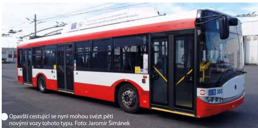
Opavští cestující se nyní mohou svést pěti novými vozy tohoto typu.

V rámci revitalizace vodních prvků v Městských sadech byly v srpnu zahájeny práce na revitalizaci jezírek, spočívající především ve vybagrování usazenin. Práce budou trvat do října a v jarních měsících dojde k osazení vodními rostlinami typickými pro Slezsko.