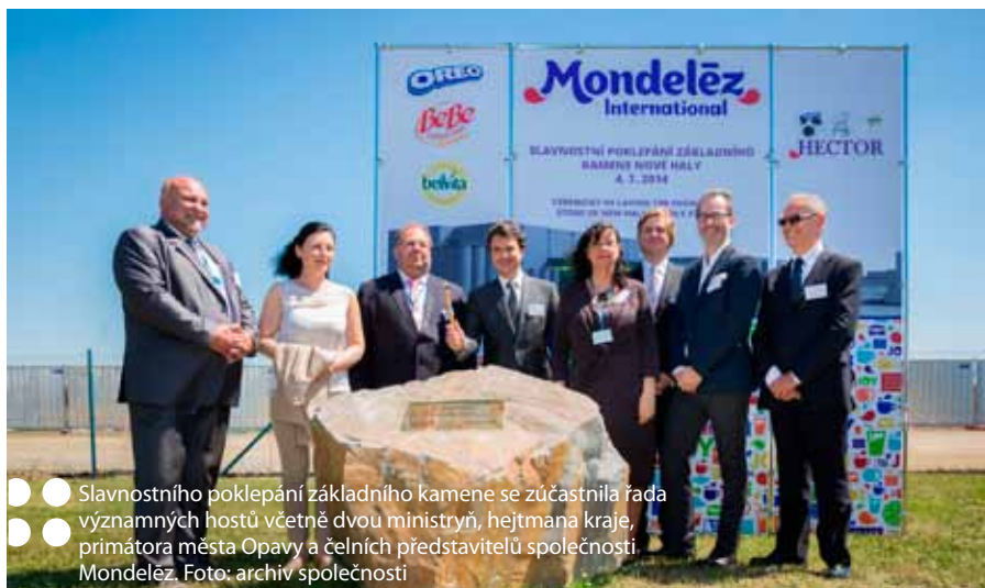
Slavnostního poklepání základního kamene se zúčastnila řada významných hostů včetně dvou ministryň, hejtmána kraje, primátora města Opavy a čelních představitelů společnosti Mondelez.