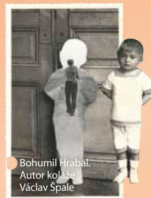
Bohumil Hrabal. Autor koláže Václav Špale

Filmové oblasti vévodí Tisícročná včela režiséra Juraje Jakubiska, nejúspěšnější filmová adaptace jednoho z děl Bohumila Hrabala – Ostře sledované vlaky, fascinující cesta k počátkům lidské kreativity režiséra Wenera Herzoga ve filmu Jeskyně zapomenutých snů, nádherný francouzský snímek Cesty do školy