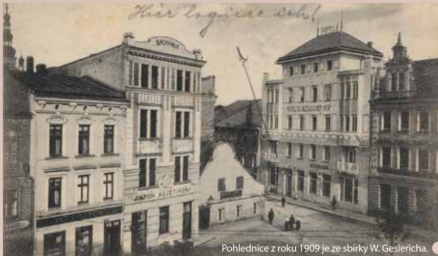
Pohlednice z roku 1909