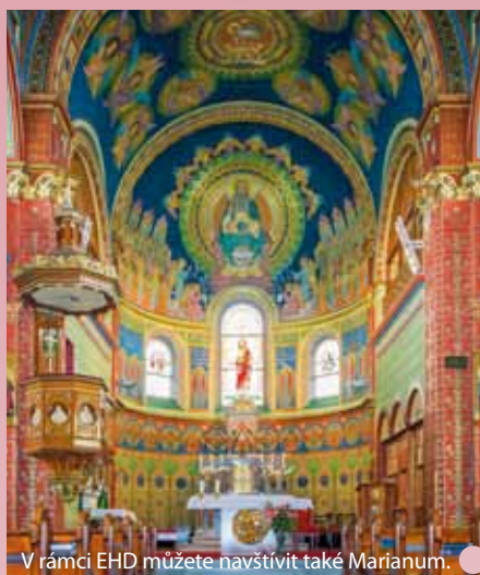
V rámci EHD můžete navštívit také Marianum.

Při oslavách výročí se slezská metropole vrací ke svým původním kořenům a toto téma se prolné i národním zahájením. Centrum