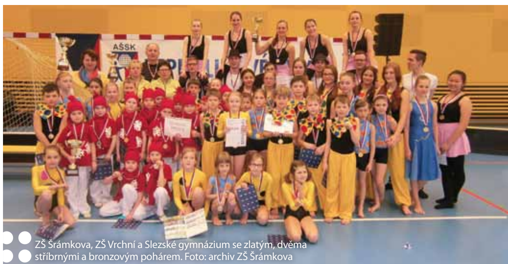
ZŠ Šrámkova, ZŠ Vrchní a Slezské gymnázium se zlatým, dvěma stříbrnými a bronzovým pohárem.