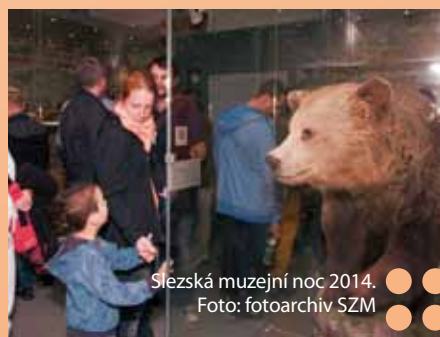
Slezská muzejní noc 2014.

Neopakovatelnou atmosféru nočních prohlídek muzeí a kulturních zařízení můžete zažít během letošního ročníku Slezské muzejní noci. Ta proběhne v pátek 19. června od 19 hodin.