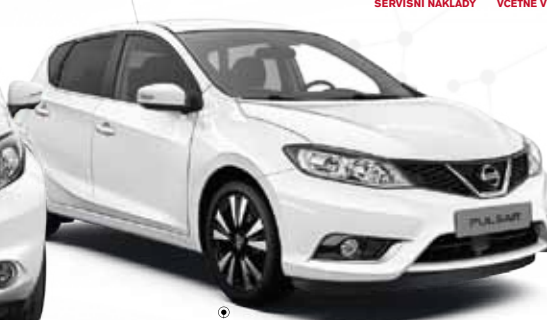
NOVÝ NISSAN PULSAR PŘESNĚ PRO VÁS

REZERVUJTE SI TESTOVACÍ JÍZDU JEŠTĚ DNES