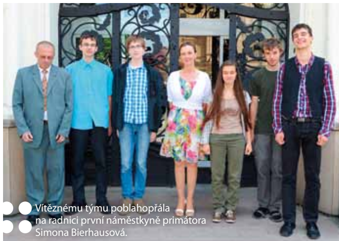
Vítěznému týmu poblahopřála na radnici první náměstkyně primátora Simona Bierhausová.

Pro vítěze ovšem Turnaj mladých fyziků celostátním kolem nekončí. Národní vítězství je totiž kvalifikací pro účast v prestižní mezinárodní soutěži International Young Physicists' Tournament, která se v tomto roce uskuteční v exotické destinaci Thajska na přelomu června a července.