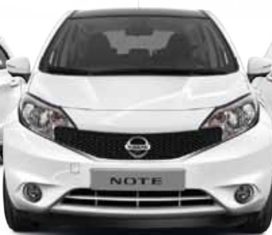
NISSAN NOTE PŘEDVÍDEJTE NEOČEKÁVANÉ