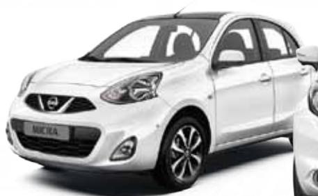
NISSAN MICRA MUSÍŠ JI MÍT