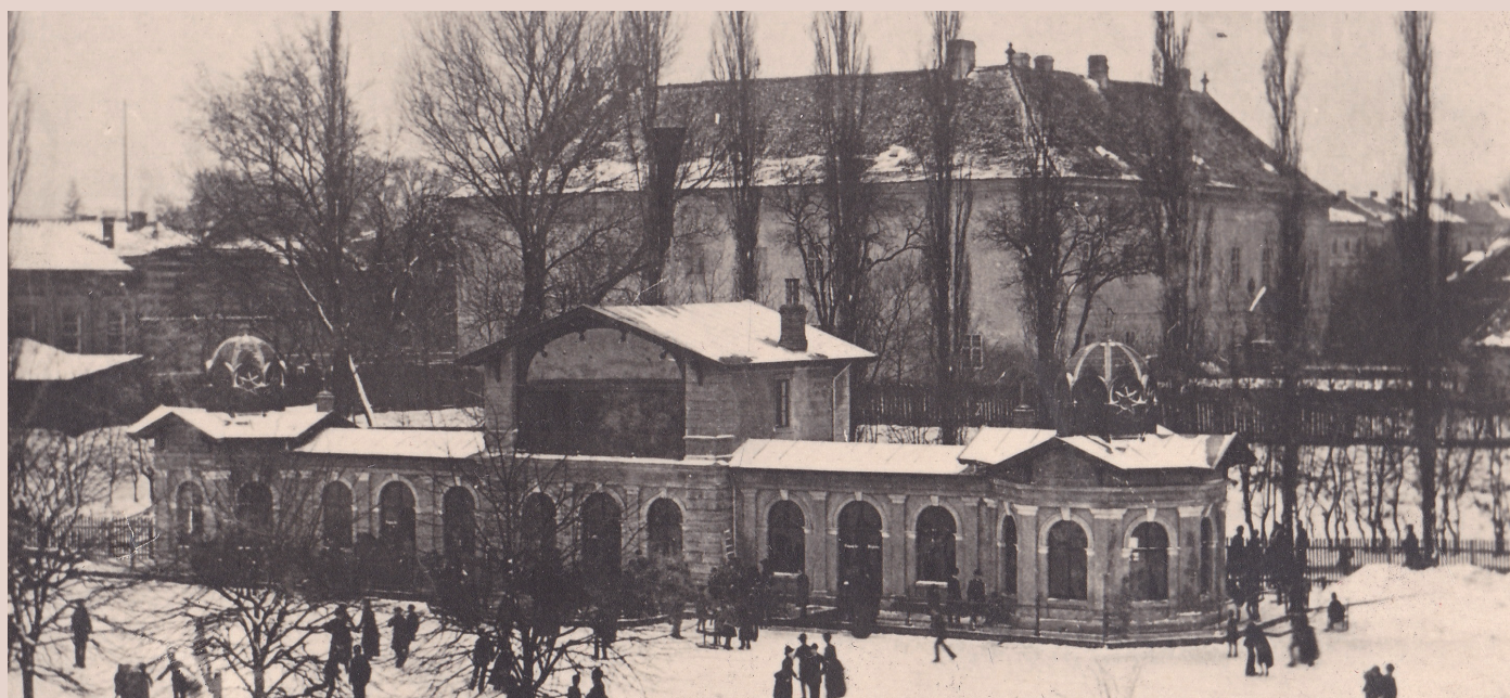
Pohled na původní podobu městského kluziště, v pozadí za stromy budova někdejšího zámku, 80. léta 19. století.