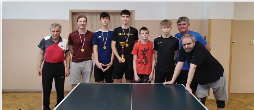
Účastníci neckyády a výherci okresního přeboru 1. třídy ve stolním tenise