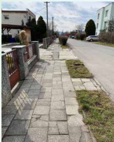
ulice U Statku