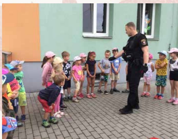
Městská policie v MŠ