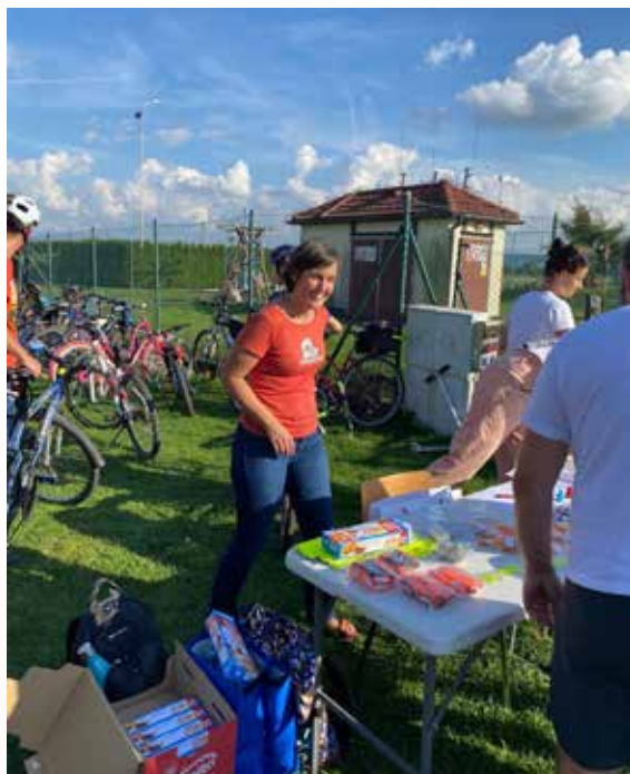
Evropský týden mobility