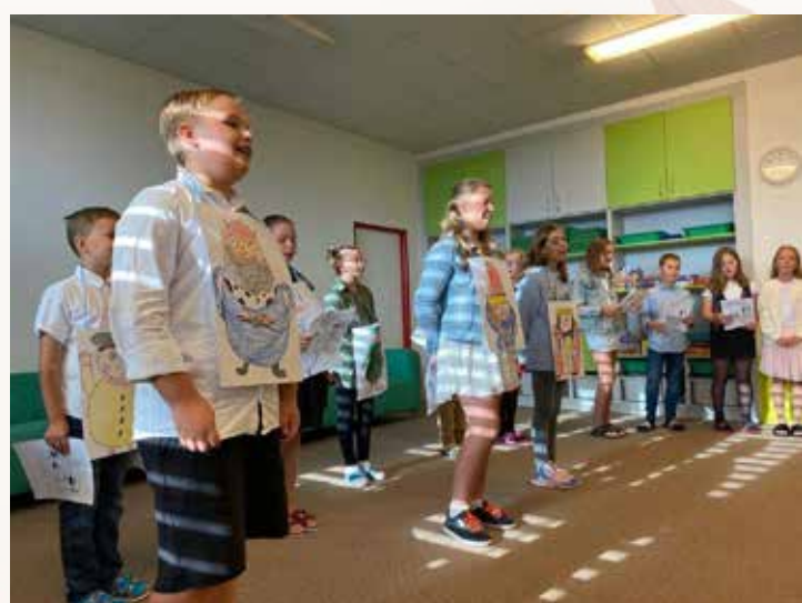
Zahájení školního roku