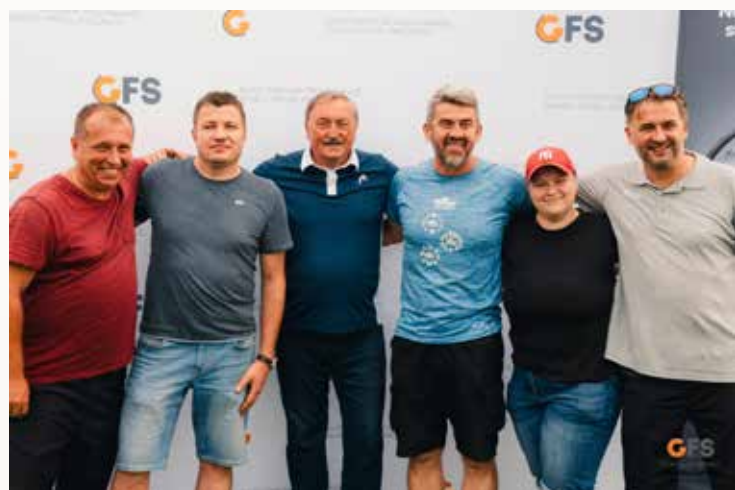
Visegrad cup 2023