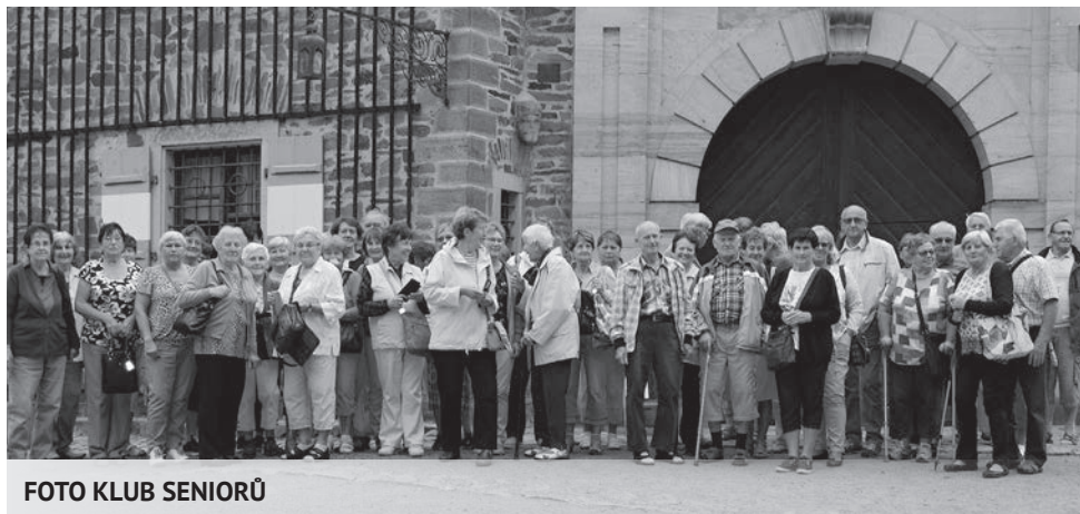
FOTO KLUB SENIORŮ

Tentokrát - už posedmé - jsme se vydali po trase našich školních výletů - Bouzov, Úsov, Javoříčko s tím, že jsme si pozměnili pořadí a zavítali jsme na hrad Bouzov a dál pokračovali na pěkný zámek v Náměšti