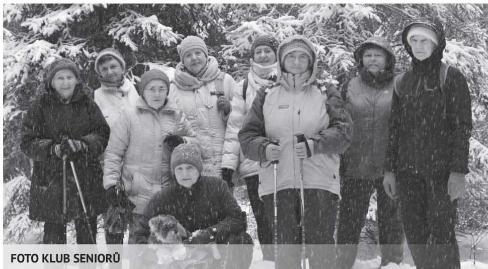
FOTO KLUB SENIORŮ