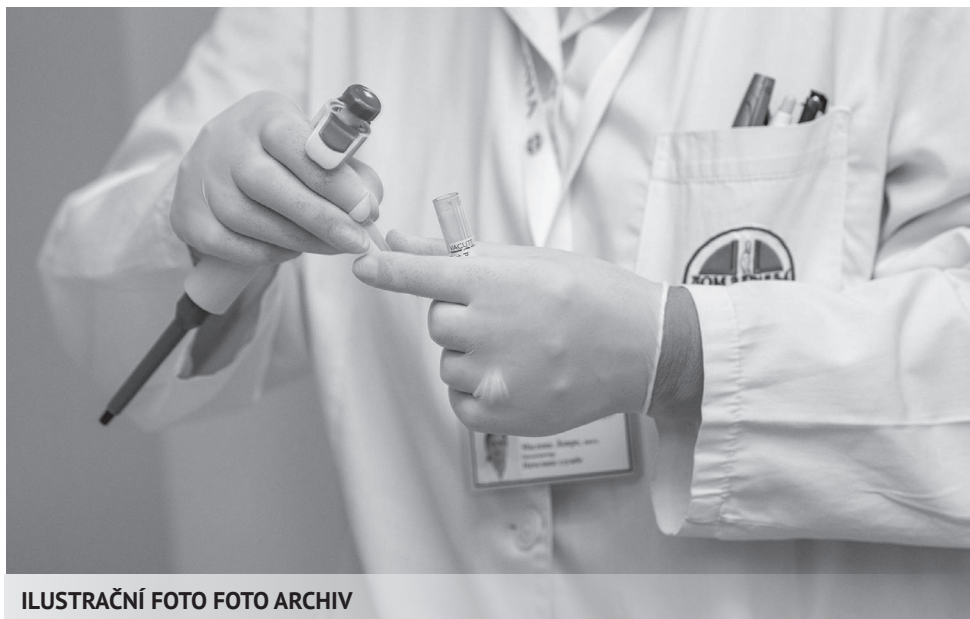
ILUSTRACNÍ FOTO FOTO ARCHIV