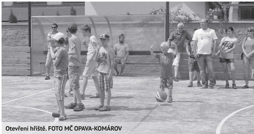
Otevření hřiště.

Přeji Vám z celého srdce ty nejkrásnější Vánoce. LUMÍR MĚCH