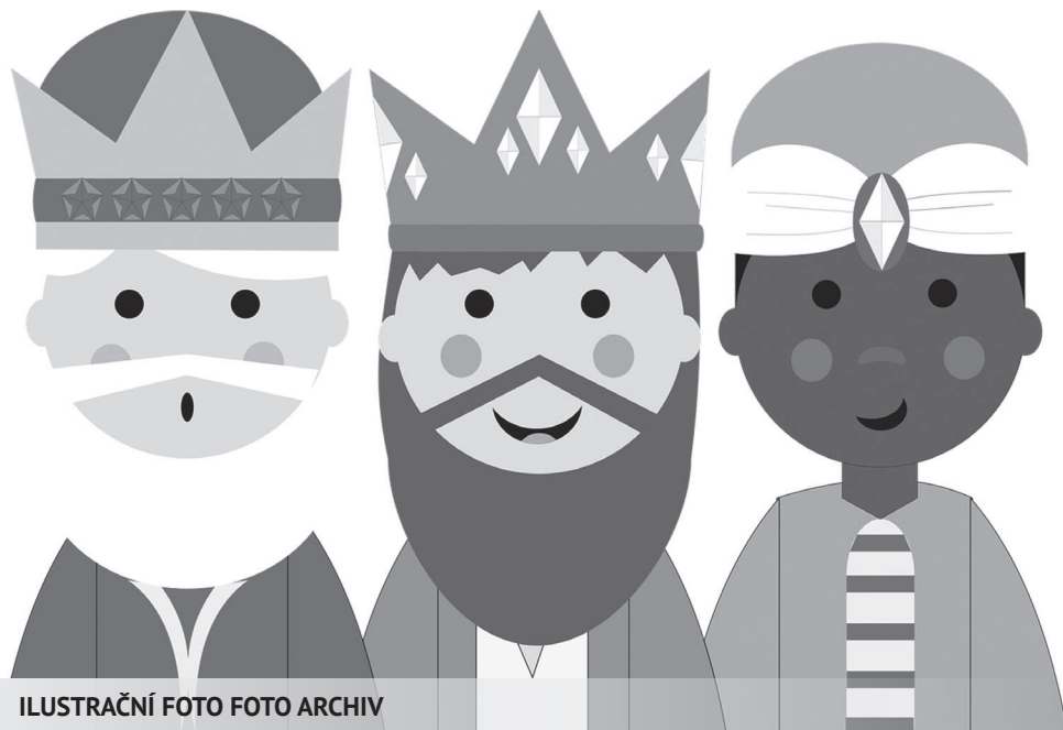
ILUSTRACNÍ FOTO

Vážení spoluobčané, Charita Opava se na nás opětovně obrátila s prosbou o pomoc při organizaci „Tříkrálové sbírky“. Rozhodli jsme se vyjít vstříc a tuto tradici zachovat.