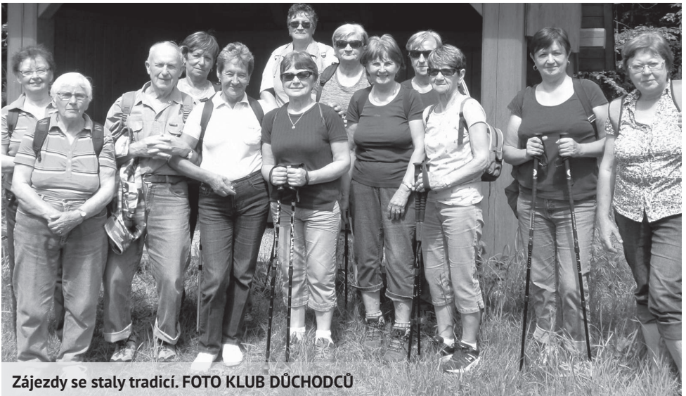
Zájezdy se staly tradicí.