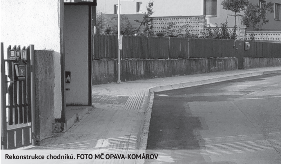
Rekonstrukce chodníků.

Vážení spoluobčané, milovými kroky se nám přiblížila doba Vánoc a tak mi dovoluji, abych u této příležitosti několika slovy zrekapituloval a zhodnotil akce realizované v letošním roce: