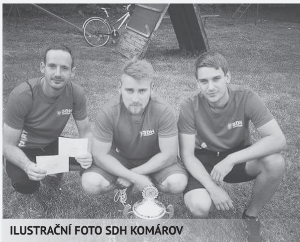
ILUSTRÁČNÍ FOTO SDH KOMÁROV

Během týdne týmy procestovaly všechny světa-díly. Prožili třeba polární noc, v Japonsku si vyzkoušeli různé pokrmy, které musely jíst dřevěnými hůlkami, krom toho zažili jízdu na vodě, také den slepých a mnoho dalších dobrodružství.