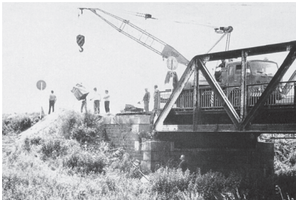
TROCHA HISTORIE | Most zvaný železný přes řeku Moravici (postavený 1912 - 1913) na silnici Komárov – Opava (FOTO 1, záběr z roku 1946). Oprava římsy železného mostu v roce 1989 (most sloužil až do roku 1994, FOTO 2).