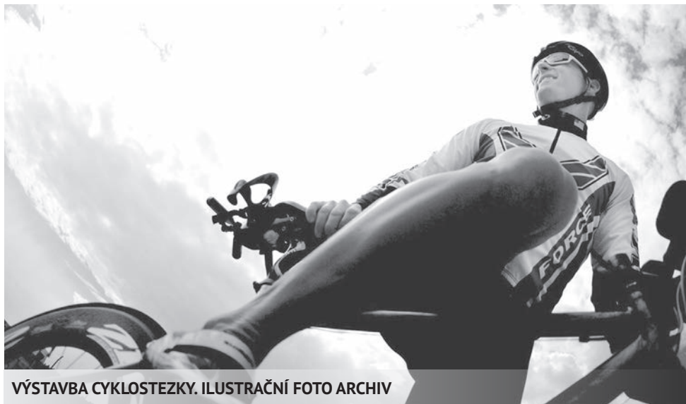
VÝSTAVBA CYKLOSTEZKY. ILUSTRÁČNÍ FOTO ARCHIV

Vážení spoluobčané, Po roce opět přichází období vánočních svátků a rok 2015 se tak přiblížil ke svému závěru. Nastává tak čas rekapitulace a hodnocení činnosti naší městské části.