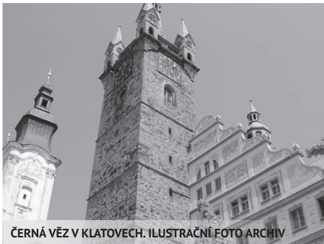
ČERNÁ VĚŽ V KLATOVECH.