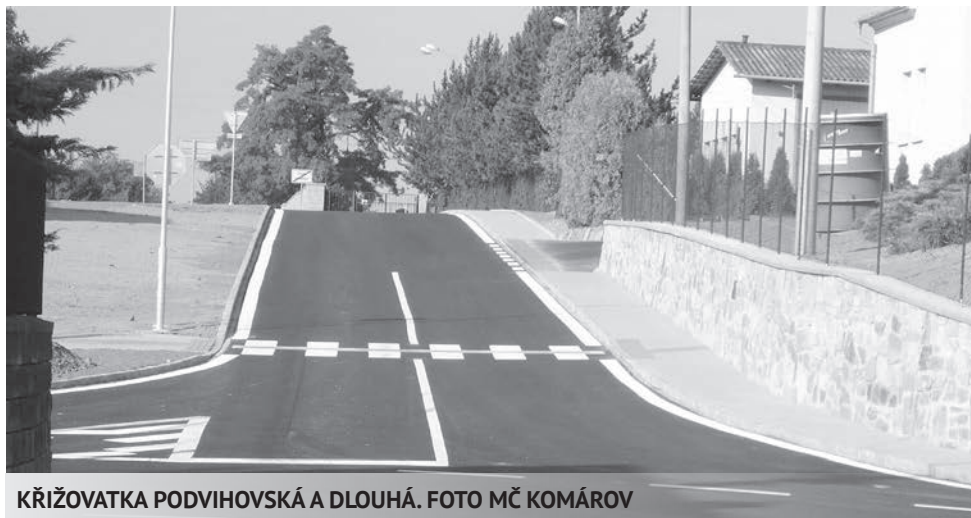
KŘIŽOVATKA PODVIHOVSKÁ A DLOUHÁ.