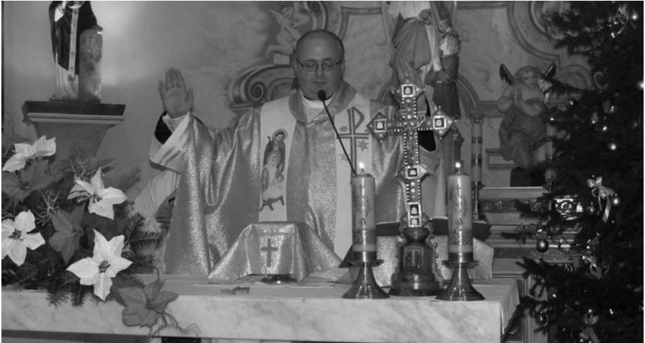
Vánoce 2014.

Přátelé! Jsem nesmírně rád, že po delší době mám opět možnost pozdravit a oslovit prostřednictvím tohoto časopisu každého občana naší obce, každého člověka dobré vůle. Víte, čím je člověk starší, tím se asi častěji, zvláště v prosinci a vůbec v období Vánoc, vrací ke své minulosti, ke svému útlému mládí a dětství. Je to příhodná doba jen tak si prostě trošku zavzpomínat na to, co už bylo dávno. V těchto dnech vrcholícího adventu se také mi vybavila jedna vzpomínka na dětství. Mohl jsem tehdy mít čtyři nebo pět let. Jako asi všude v křesťanských rodinách se také u nás před Štědrým dnem chystal stromek a stavěly jesličky. Vzpomínám si, jak mamka vytáhla zpod skříně velikou krabici a z balícího papíru v ní jsme začali vyndávat jednotlivé figurky. Vzal jsem z balíku postavičku pastýře a snažil jsem se ho přidat k ostatním postavičkám v betlémě. On ale nechtěl nějak stát. Stále padal. Stalo se to během chvilky. Postavička se převrátila, spadla na zem a ulomila si nohu. S pláčem jsem uháněl k mamce. Ta vyslechla můj žalostný křik a dala mi do ruky další balíček. Začal jsem jej pozvolna rozbalovat a z krabíčky jsem vyndal jesličky s postavou Ježíška. Tehdy jsem si jen matně