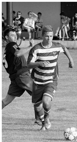
Komárovským mužům patří po podzimu 7. místo.