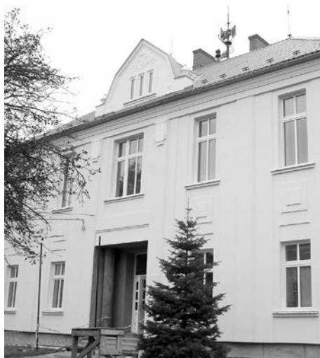
Nová podoba budovy v Nových Sedlicích.

MŠ Komárov má v současné době tři naplněné třídy a již několik let spolupracuje s místní