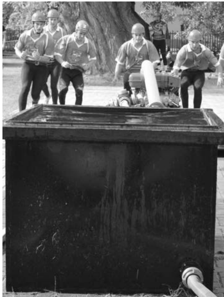
Momentky ze soutěží v roce 2014 SDH Komárov.