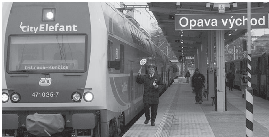
ELEKTRIFIKACE trati byla dokončena v roce 2007.

vými a staničními strážníky, rozmístěnými na trati na dohled od sebe. Stožárová návěstidla u strážních stanovišť však byla zdokonalena, měla místo proutěných košů ramena, za tmy osvětlována lampami. Ve stanici Opava pracovalo v té době 16 železničářů. Zpočátku byly vypravovány čtyři vlaky denně. Od počátku provozu byla na trati jedna mezilehlá stanice v Háji a zastávky Dvořisko-Štítina a Komárov. V té době byla na trati jediná vlečka, která vedla ze stanice Háj do místního cukrovaru, který byl vystavěn v roce 1855. V roce 1857 pak přibyla zastávka Děhylov-Hlučín, zastávka Dvořisko-Štítina byla k 15. říjnu 1893 rozšířena na zastávku a nákladíště a v období před vznikem Československa byla zřízena ještě zastávka Jilešovice. V roce 1923 pak přibyla zastávka Lhota-Mokré Lazce, jejíž název se v roce 1937 změnil na dnešní Lhota u Opavy. V poválečném období přibyla zastávka Mokré Lazce (1947). Vzhledem k rostoucímu objemu dopravy bylo také nutno přistoupit ke zvýšení propustné výkonnosti. Proto byla zřízeny dvě hlásky : Lhota u Opavy a Opava-Komárov. Ze strany místních úřadů byly činěny pokusy o zřízení zastávky Smolkov, k tomu však nedošlo. Poslední významnou změnou bylo postavení stanice Opava-Komárov, která byla uvedena do provozu v roce 1992. Trať byla také několikrát