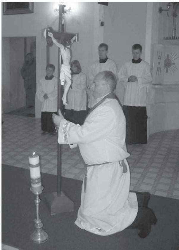
VELIKONOCE 2014. ILUSTRÁČNÍ FOTO ARCHIV

Nechce se nám trpět, nechceme být omezováni! Jenže pokud si své vlastní zranění a omezení nepřiznáme a dereme se za svými nereálnými plány, tak nám hrozí, že zničíme sami sebe i všechno kolem. Kolik lidí je dnes vystresovaných a zničených z toho, že nedokážou dostat svým nedostižným ideám? Kolik lidí se dnes dere za něčím, co nikdy nemůžou získat, a proto, že jim to nejde, se utápějí v různých závislostech. Potřebují zkrátka potlačit úzkost z toho, že nejsou tím, čím by chtěli být. Kéž bychom se dokázali na sebe podívat víc pravdivě, přiznat si svá omezení a radovat se z toho, co máme... Možná by pak na světě bylo méně zla vzniklého z alkoholismu, hazardu nebo drog! Zranění, pokud s ním člověk nepracuje, ho může zlikvidovat! Kéž bychom našli více odvahy podívat se na své bolesti a neutíkat od