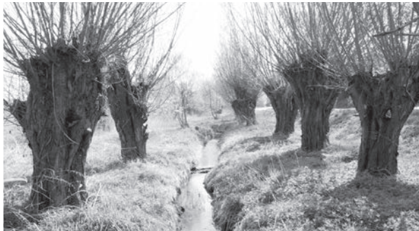
MEZI OBLÍBENOU potravu bobra patří větvíčky a lýko vrby. ILUSTRACNÍ FOTO ARCHIV

výrazných změn v uspořádání populace. Jamímu vrhu mláďat předchází vyloučení nejstarších potomků z teritoria proto, aby jejich místo mohli nahradit nejmladší jedinci z přicházejícího vrhu. Jde o důležitý moment v každoročním vývoji a rozvoji populace bobrů. Nově vyloučení migrující jedinci musejí najít své místo v populaci. Zpravidla mají k dispozici dvě možnosti: obsadit již existující teritorium či nalézt si nové, ještě neobsazené. Popsaný princip je hlavním hnacím motorem pro šíření bobrů krajinou. V jednom úseku řeky nikdy nežije více rodin, to je mylná představa. Mezi oblíbenou potravu bobrů patří mimo vegetační období především lýko a větvíčky topolu a vrby, nepohrdne však ani jinými dřevinami. V zimě vyhledává řepkové pole, v létě hojně využívá přilehlé kukuřičné či řepové pole, odkud vede množství cestíček do řeky. V létě hromadí potravu na zimu. Ne vždy si bobří tvoří obydlí stavěním hrází či hradů v řece. Vysoké jílovité břehy a dostatečná hloubka řeky v okolí Komárova umožňuje bobrům stavbu obydlí v těchto březích. Proto lze bobry v této lokalitě bez vystavěných hrází velmi těžko vystopovat. Bobří jsou aktivní po celý rok a jsou noční zvířata. Ze svého obydlí vyrazí hned po setmění a vracejí se až pozdě k ránu. Přes den odpočívají. Nejznámějším znakem jejich přítomnosti jsou typické okusy stromů. V souvislosti s přítomností bobrů v krajině a důsledky jejich život-