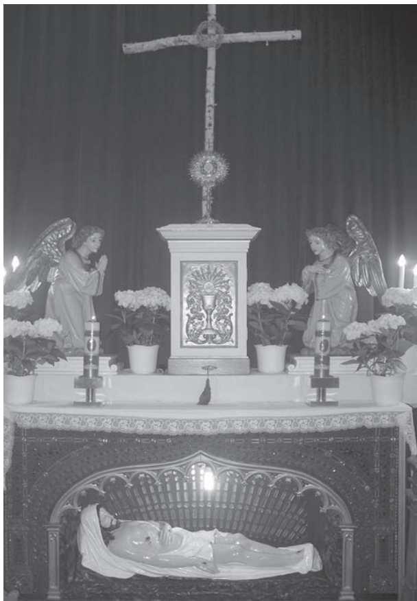
VELIKONOCE 2014.

Prožívání smutku a radosti během velikonočních svátků nám má připomenout, že bolest a radost spolu úzce souvisí! Obojí patří k životu. Ani jedno ani druhé nelze úplně ze života vymazat. A dokonce jsou tyto dvě emoce v životě člověka