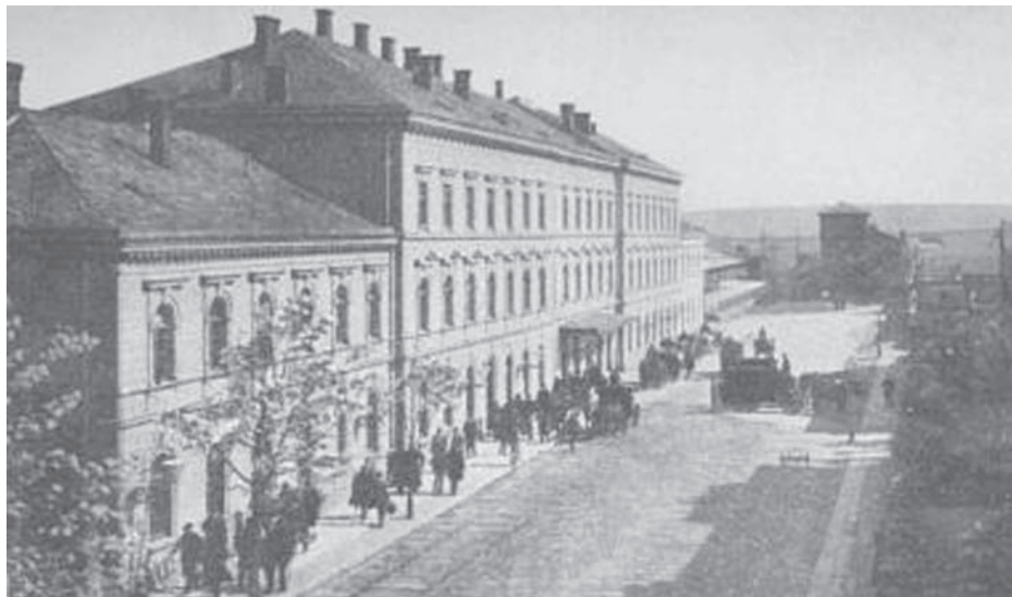
OPAVA-VÝCHOD: historické foto.

Spodní stavba trati pokračovala pomalu. Při zemních pracích zcela převažovaly násypy nad zářezy, takže materiál se musel dovážet. Opozdílo se též schválení projektu trati v úseku Komárov – Opava a to odsunulo zemní práce na jaro, kdy jsou potíže se zemědělskými potahy a povozy, použití povozů z Pruska také naráželo na pasové a měnové potíže. Dodržení termínu stavby ohrožovaly velké sněhové srážky, později povodně a nemoci dělníků. Přesto mohlo podnikatelství Kleinů začít na podzim 1855 klást železniční svršek s hříbovými kolejnicemi jako na hlavní trati. Železné kolejnice byly asi pěti-metrové, upevněny byly v litinových stoličkách, připevněných vždy na sedmi pražcích.