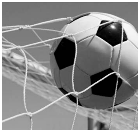
ILUSTRACNÍ FOTO ARCHIV

Určitě stojí za zmínku, že herně a výsledkově se nám dařilo s mužstvy z horní