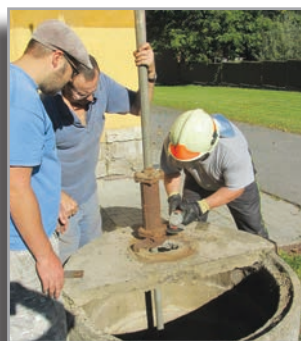
Situace v orlovně