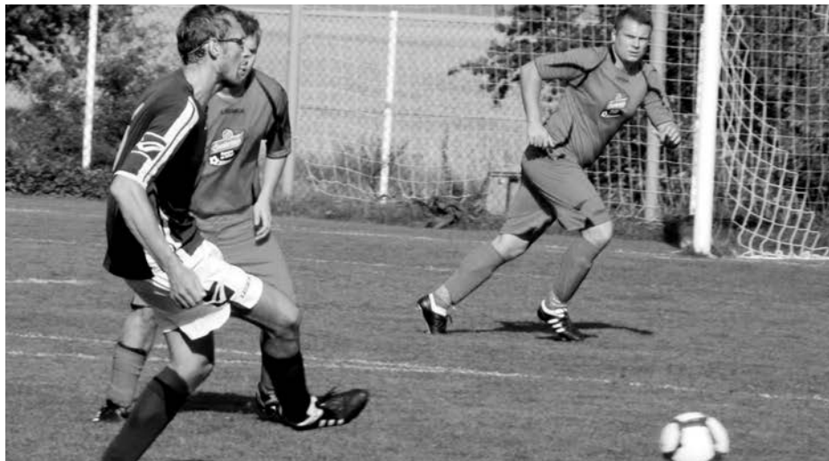
ILUSTRÁČNÍ FOTO ARCHIV