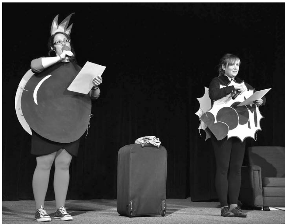
ILUSTRÁČNÍ FOTO ARCHIV

Leden Novoroční koncert 28. duben Pálení čarodějnic 19. květen Divadlo (ochotnické divadlo ze Štítiny) Červen Den dětí Červenec Posvícenecký turnaj v malé kopané