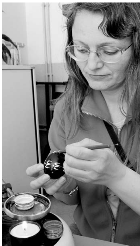
BARVENÍ VAJEC k Velikonočním neodmyslitelně patří.