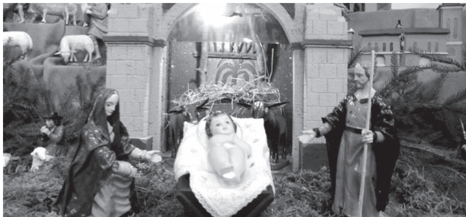
ILUSTRACNÍ FOTO ARCHIV