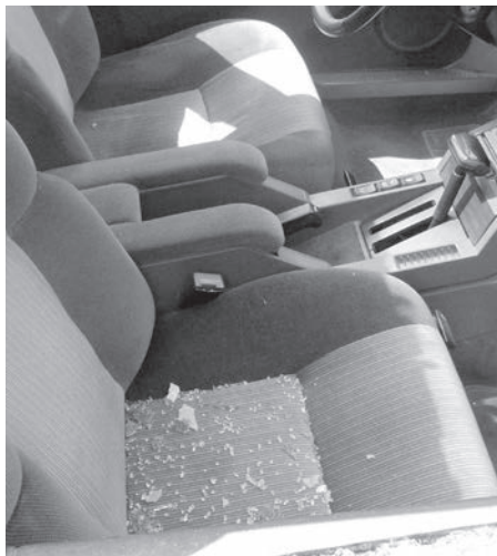
DVĚ VYKRADENÁ AUTA Hned dvakrát v jednom dni se neznámý pachatel zaměřil na sobní auta. ILLUSTRACNÍ FOTO ARCHIV

Ke druhému případu vloupání do vozidla došlo na stejném místě. Do zde zaparkovaného osobního automobilu tovární značky Škoda Fabia pachatel vnikl po předchozím rozbití okna levých zadních dveří. Z vozu odcizil stolní počítač, nezjištěné značky, bez dalšího příslušenství, v hodnotě patnácti tisíc korun. Další škodu deseti tisíc napáchal poškozením vozidla. (MNO)