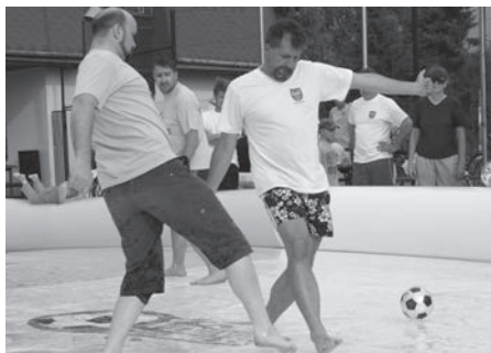
NOVÉ AKCE K novým akcím patřil turnaj ve vodním fotbálku.