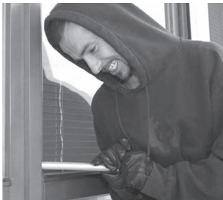
NOČNÍ VLOUPÁNÍ Drzost pachatelů nezná mezí.

Otevřená ventilace spodní části okna kuchyně rodinného domu na Dlouhé ulici zlákala v noci z 2. na 3. července neznámého pachatele. Přes otevřenou spodní část okna kuchyně rodinného domu prostrčil ruku a otevřel si tak i horní díl tohoto okna, kterým poté do místnosti kuchyně vnikl. Z této místnosti následně odcizil notebook, USB flash disk a dva mobilní telefony. Z kabelky volně odložené na židli v kuchyni pachatel odcizil dva svazky klíčů včetně dálkového ovládání k vozidlu a dámskou koženou peněženku (červené barvy) s finanční hotovostí dvou tisíc korun a platební kartou. Z kuchyně pachatel dále odcizil i troje náramkové hodinky a klenoty, které byly uloženy ve šperkovnici (řetízek s přívěskem ze stříbra v kombinaci s českým granátem, stříbrné náušnice s českým granátem, řetízek tmavomodré barvy s přívěskem ve tvaru srdce, stříbrný řetízek s přívěskem a náušnicemi ve tvaru slzy, zlatý snubní prsten, prsten z bílého zlata se zirkony a prsten z bílého zlata s očkem ze zirkonu. Sedmatřicetiletému muži z Opavy odcizil neznámý pachatel věci v celkové hodnotě přes sedmatřicet tisíc korun. (MNO)