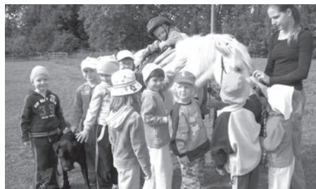
ŠKOLKA Ve školce v Nových Sedlicích mají do přírody blízko.

I v letošním školním roce máme v mateřské škole plně využitou kapacitu – 28 dětí. Nově jsme přivítali devět kamarádů, do první třídy odešlo pět dětí. Naše mateřská škola je pro rodiče atraktivní svou polohou – jsme vesnická MŠ, která nabízí vycházky do přírody, pozorování života zvířat chovaných lidmi v ohradách (koňů, ovcí, koz), ale také života u vody – potoka, řeky, přehrady. Rozvíjíme pohybové aktivity dětí na rozlehlé školní zahradě i na místním hřišti, kde je velkou atrakcí trampolína. Nedílnou součástí života v naší školce jsou akce pro děti, pořádané ve spolupráci s rodiči, obecním úřadem či hasiči. Letos se děti mohou těšit na drakiádu, jízdu na poníkovi, vánoční tvoření, velikonoční zpívání a mnoho dalších akcí, pro zájemce bude nově probíhat výuka plavání v aquaparku Kravaře. Těšíme se, co nám nový školní rok přinese a co se nám s dětmi podaří. Držte nám palce. (RED)