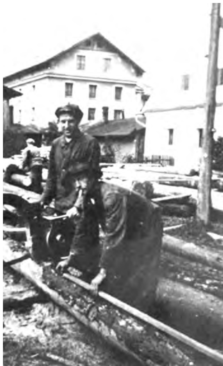
PILA KARLA JASCHKA Pohled z roku 1935, uprostřed budova mlýna, vpravo státek.