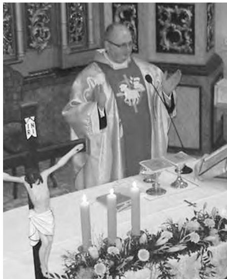
VELIKONOCE Svátky jara jsou tady.

Milí přátelé! Opět tady máme krásné a úchvatné jaro. V křesťanském životě spolu s tímto ročním obdobím přicházejí také důležité oslavy. Už od Popelce, který byl letos 9. března, skrze postní dobu se připravujeme na Svátý týden, který začneme žehnáním ratolestí na Květnou neděli 17. dubna a na Velikonoce, které letos slavíme v neděli 24. dubna.