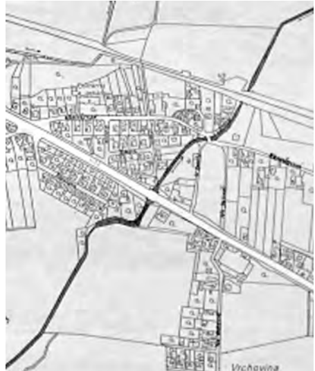
HRANICE KATASTRU Hranici katastrálního území byl potok Hošťata (uprostřed).

Název údajně pochází z dob, kdy v jeho vodách křtili šířitelé (hosté) katolické víry místní pohany. Jižní stranu obce (vč. Komárovských Chaloupek) tvořila část Podvihov – Raduň a pak se lomila severním směrem k jižnímu okraji lesa zvanému dodnes Kout a odtud v řečišti hraničního potůčku, tekoucím v rovnoběžném směru s okresní silnicí Raduň – Komárov a v pravotočivé zatáčce této silnice se pak odklonila na sever k objektu Černého mlýna, který byl styčným bodem katastru Kylešovic, Raduň a Komárova. Dále pokračovala hranice korytem