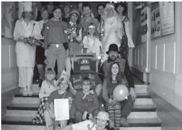
Na sklonku ledna se komárovská základní škola proměnila v pohádku od pudy až po sklep.

Ráno jsem nemohl do spat, a tak jsem vstal už v šest hodin. Měl jsem velkou trému a bál jsem se, že něco zkazím. Konečně jdu do školy a hned běžím do obchodu pro bílé ubrusky, potom ještě jednou, tentokrát pro chleba. V 9.00 začali chodit rodiče a děti. Já