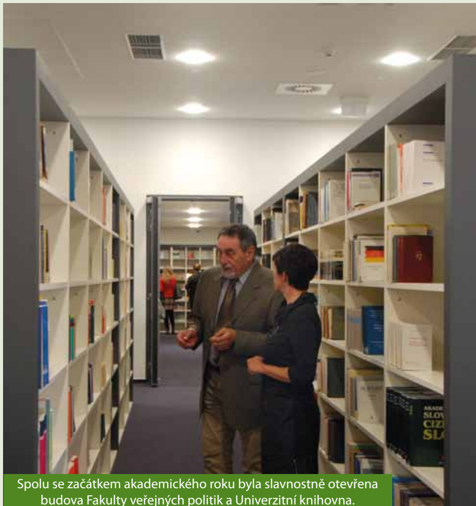
Spolu se začátkem akademického roku byla slavnostně otevřena budova Fakulty veřejných politik a Univerzitní knihovna.

To určitě ne. Jsou to dvě zcela odlišné pozice. Mají-li něco společného, tak je to tvůrčí činnost a aktivní přístup. Zatímco práci pedagoga miluji a dělám ji rád a od srdce, protože je pro mne vlastně i mým koníčkem, role rektora přede mne staví stále nové a nové výzvy, které rád přijímám, protože díky nim je můj život pestřejší a já mám pocit, že dělám něco, co má smysl. Jako rektor jsem de facto úředníkem, který se musí řídit platnými zákony a normami, má jasně vytyčené hranice a jeho aktivní