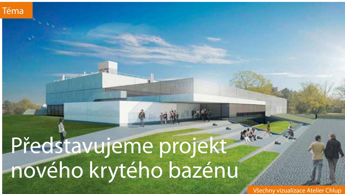
Všechny vizualizace Atelier Chlup