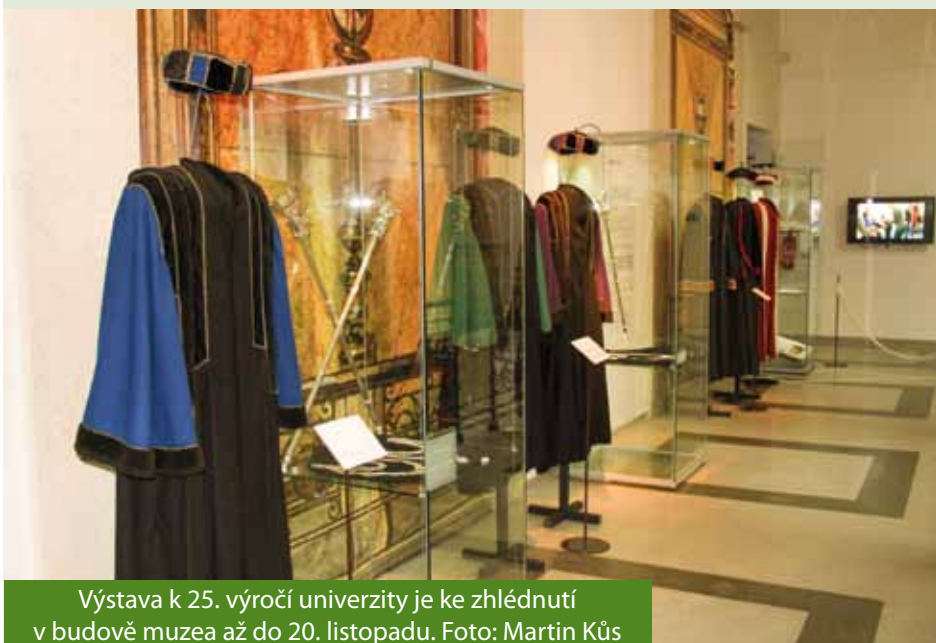
Výstava k 25. výročí univerzity je ke zhlédnutí v budově muzea až do 20. listopadu.