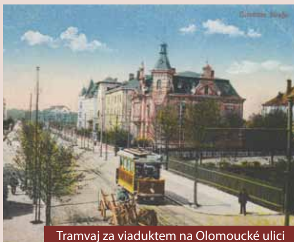
Tramvaj za viaduktem na Olomoucké ulici