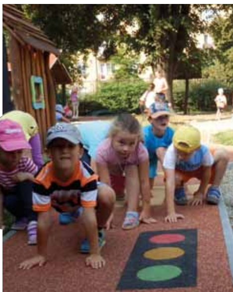
Děti z Mateřské školy křesťanské využívají díky opavské firmě nové interaktivní chodníčky.