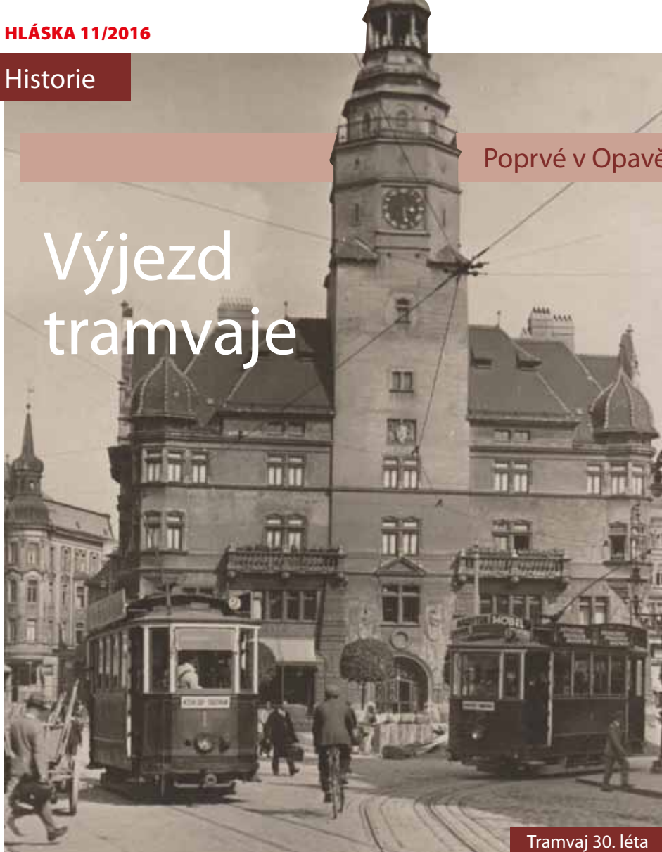
Tramvaj 30. léta

Výjezdu prvních tramvají leckde předcházela koňská dráha, někde (Brno, Ostrava) i tramvaj parní, ale Opava projevila zájem jen o tramvaj elektrickou. Významným inovátorem tohoto druhu městské dopravy byl František Křížík, který prezentoval možnosti dopravy poháněné elektrinou již v roce 1891 na Jubilejní výstavě v Praze. Technik, který zanechal svou stopu též ve Slezsku, neboť na počátku své profesní dráhy pracoval v Krnově, kde zkonstruoval elektrinou ovládané železniční návěstidlo.