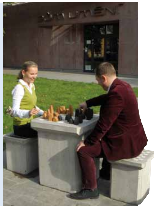
ti. V rámci pravidelných dílen tak figurky vyrábí vězni v Horním Slavkově.

Šachové stolky a židle pro veřejné venkovní použití jsou vyráběny z betonu. Stolky jsou zhruba půltunové, váha židlí se pohybuje okolo 100 kilogramů. Šachové figurky vznikají ve spolupráci s neziskovou organizací Rubikon Centrum, jejíž snahou je opětovně začlenit lidi s trestní minulostí do společnos-