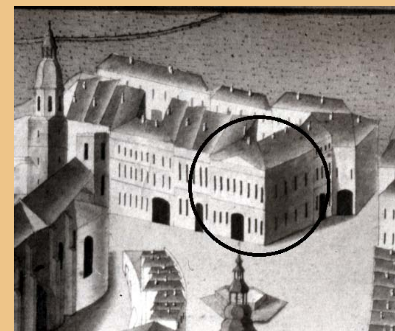
• Dobové vyobrazení domovního bloku s hotelem U Zlaté koruny, staré čp. 176 (zcela upravo) vytvořené v roce 1829 opavským stavitelem Georgem Frischem