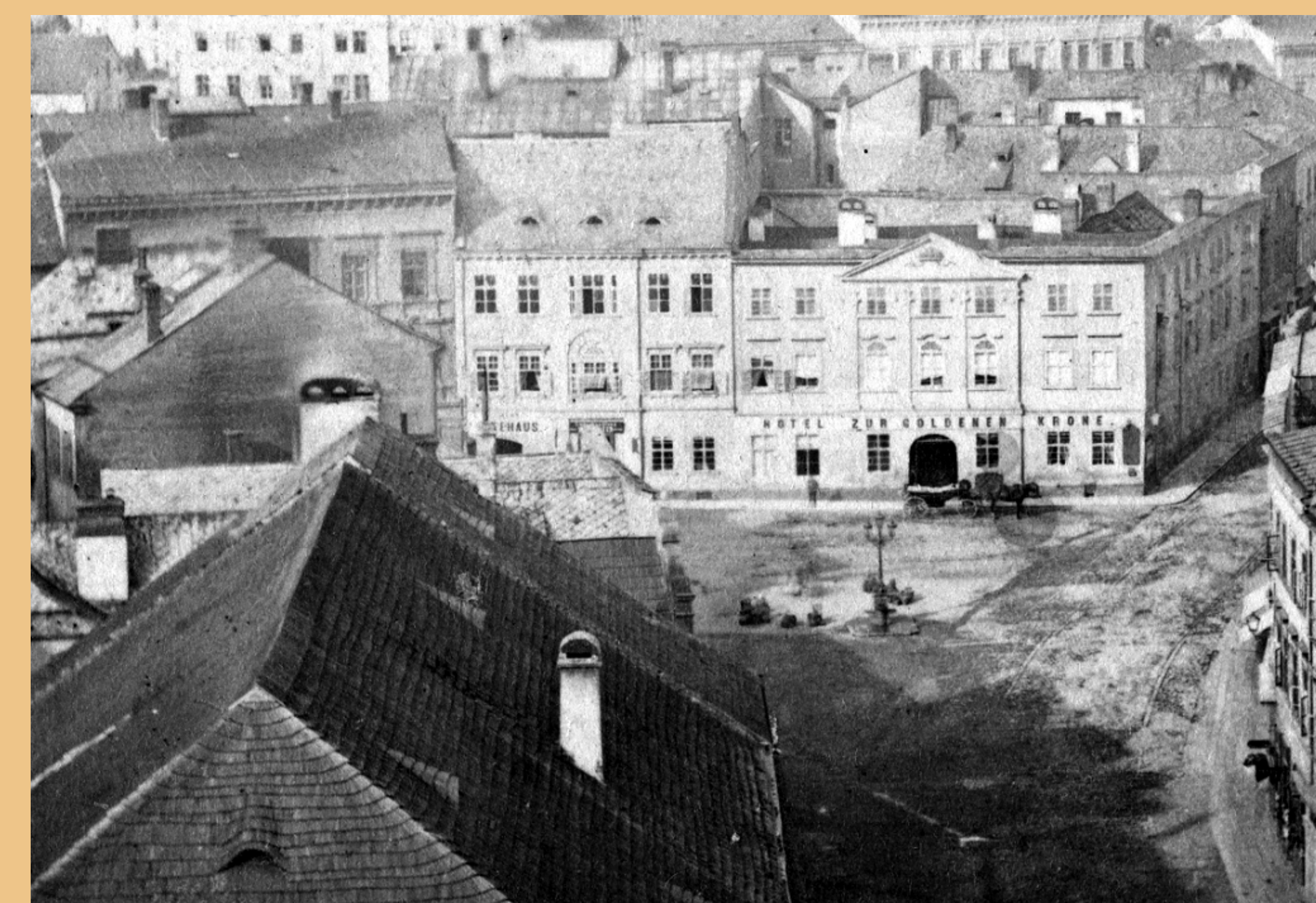
• Domovní blok ukončený nárožním objektem hotelu U Zlaté koruny při pohledu z městské věže Hlásky, výřez z černobílé fotografie, poslední třetina 19. století.