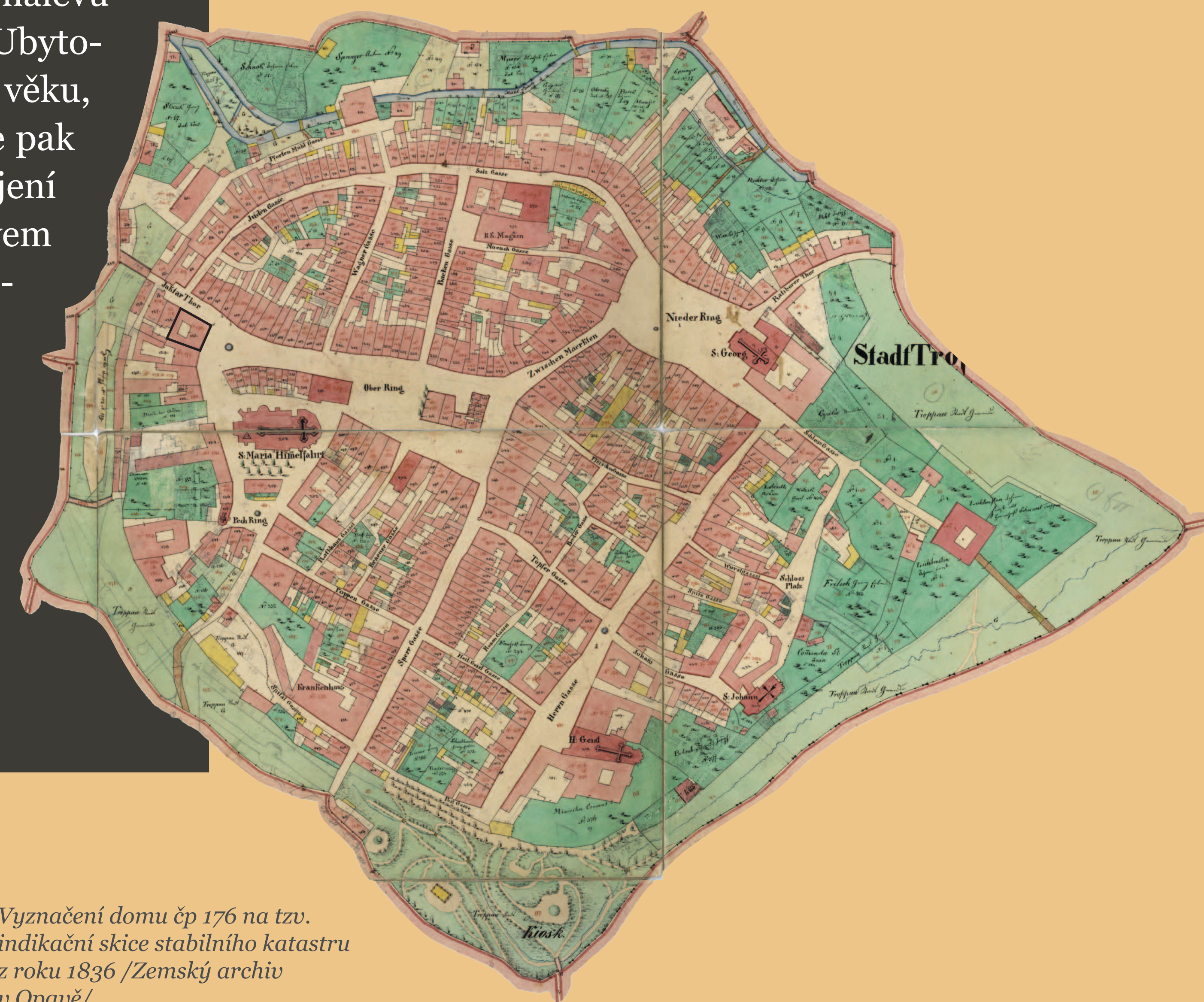
• Vyznačení domu čp 176 na tzv. indikační skice stabilního katastru z roku 1836