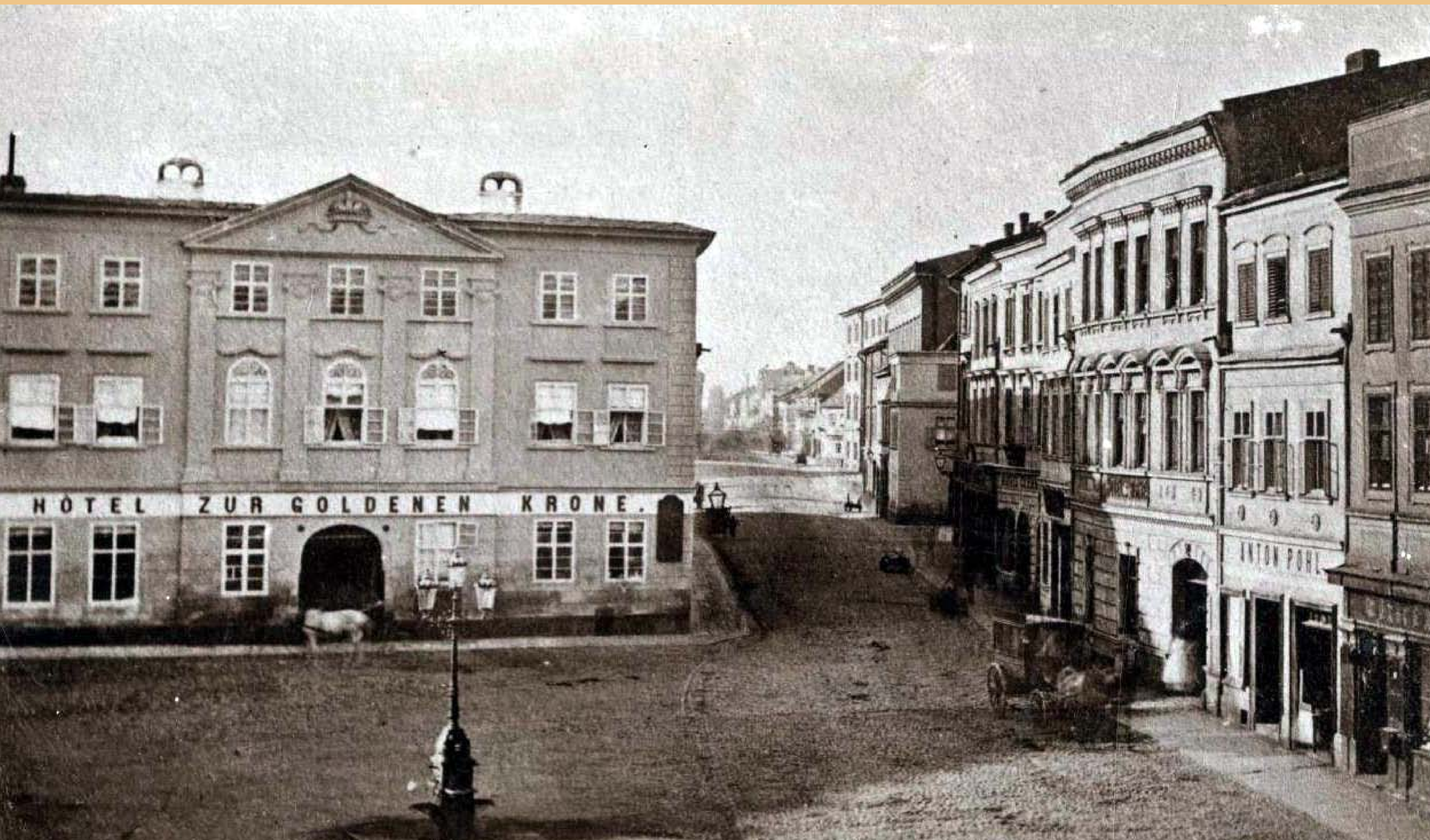
• Klasicistně-barokní podoba fasády hotelu U Zlaté koruny při pohledu z Horního náměstí, poslední třetina 19. století

Horní náměstí, staré číslo popisné 176, demolováno v roce 1977; dnes na tomto místě budova na Náměstí republiky 450/17; místo ubytování diplomatických kurýrů či umělců, například dánského sochaře Bertela Thorvaldsena, polského sochaře Pawła Malińskiego nebo dánského architekta Simona Christiana Pontoppidana