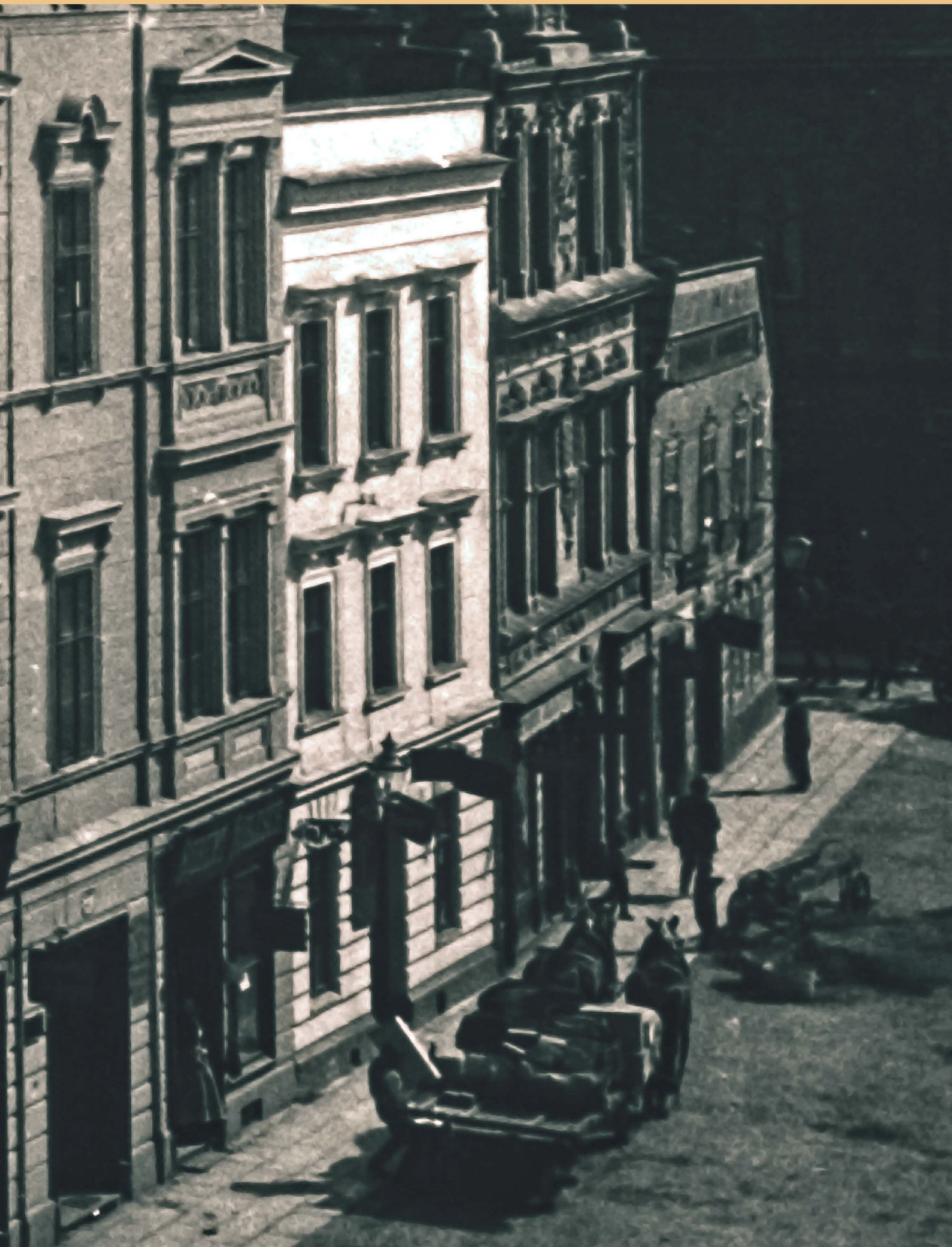
• Domovní blok, v němž je jako druhý zleva dokumentovaný objekt staré čp. 388, ve kterém v době konání Opavského kongresu sídlil krajský úřad, výřez z fotografie pořízené v závěru 19. století.

Panská ulice, staré číslo popisné 388, demolováno po 1945; dnes na tomto místě budova Masarykova třída 352/27; někdejší sídlo Krajského úřadu v Opavě