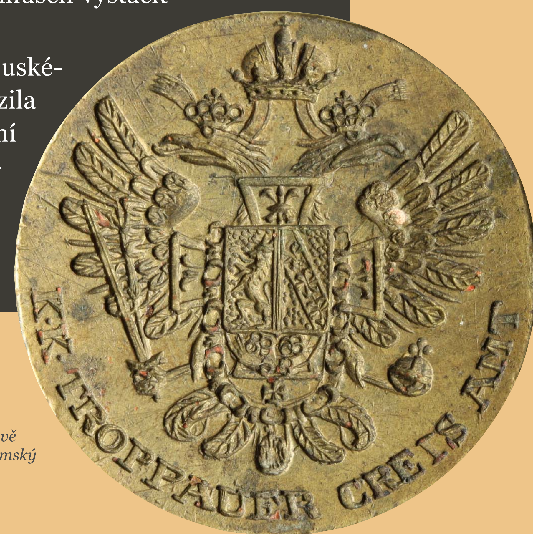
• Pečetidlo Krajského úřadu v Opavě z prvních desetiletí 19. století /Zemský archiv v Opavě/