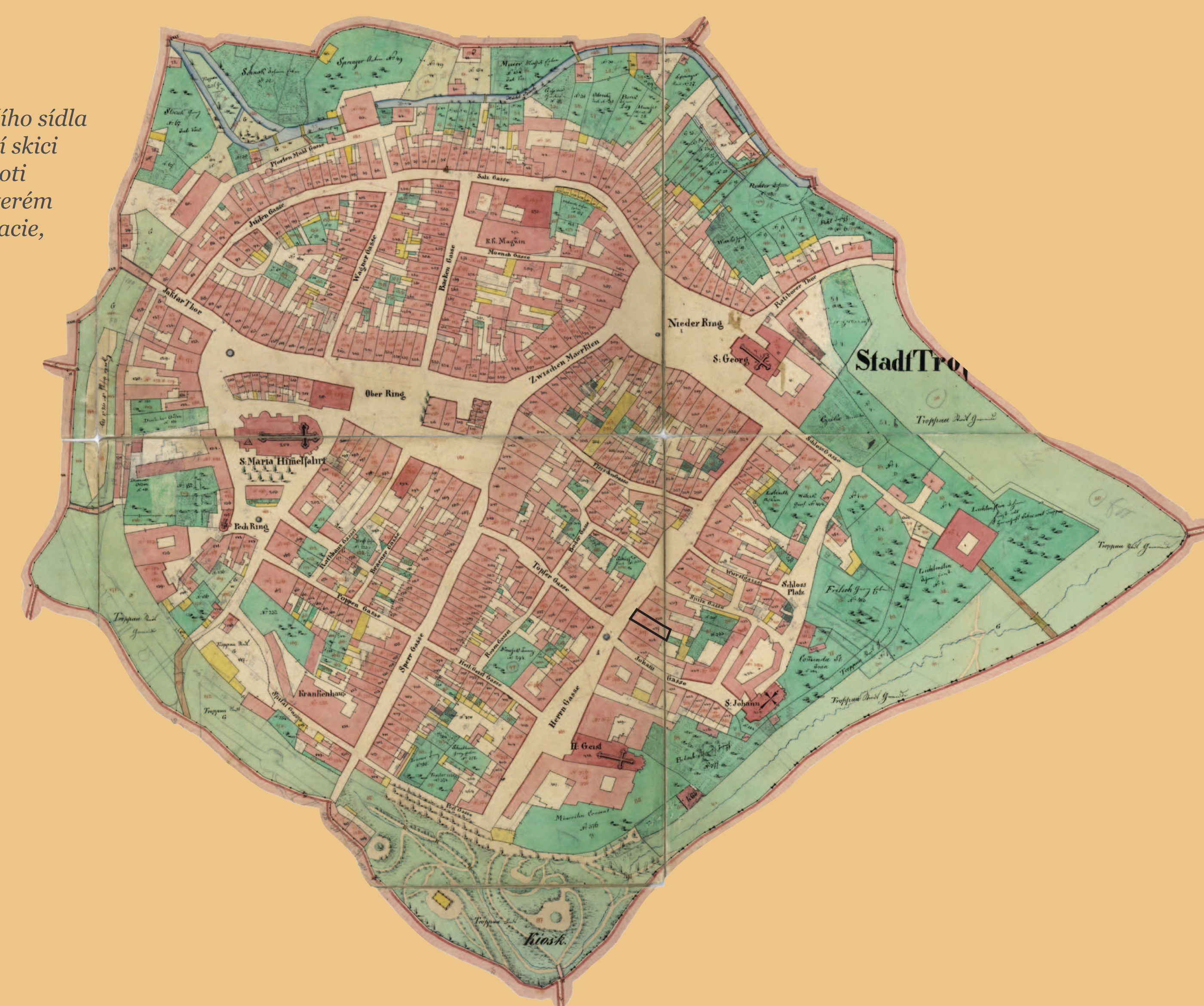
• Vyznačení domu čp. 388 – tehdejšího sídla Krajského úřadu, na tzv. indikační skici z roku 1836. Dům stál přímo naproti Paláci Sedlnických (čp. 298), ve kterém byl ubytován šéf rakouské diplomacie, kníže Metternich.