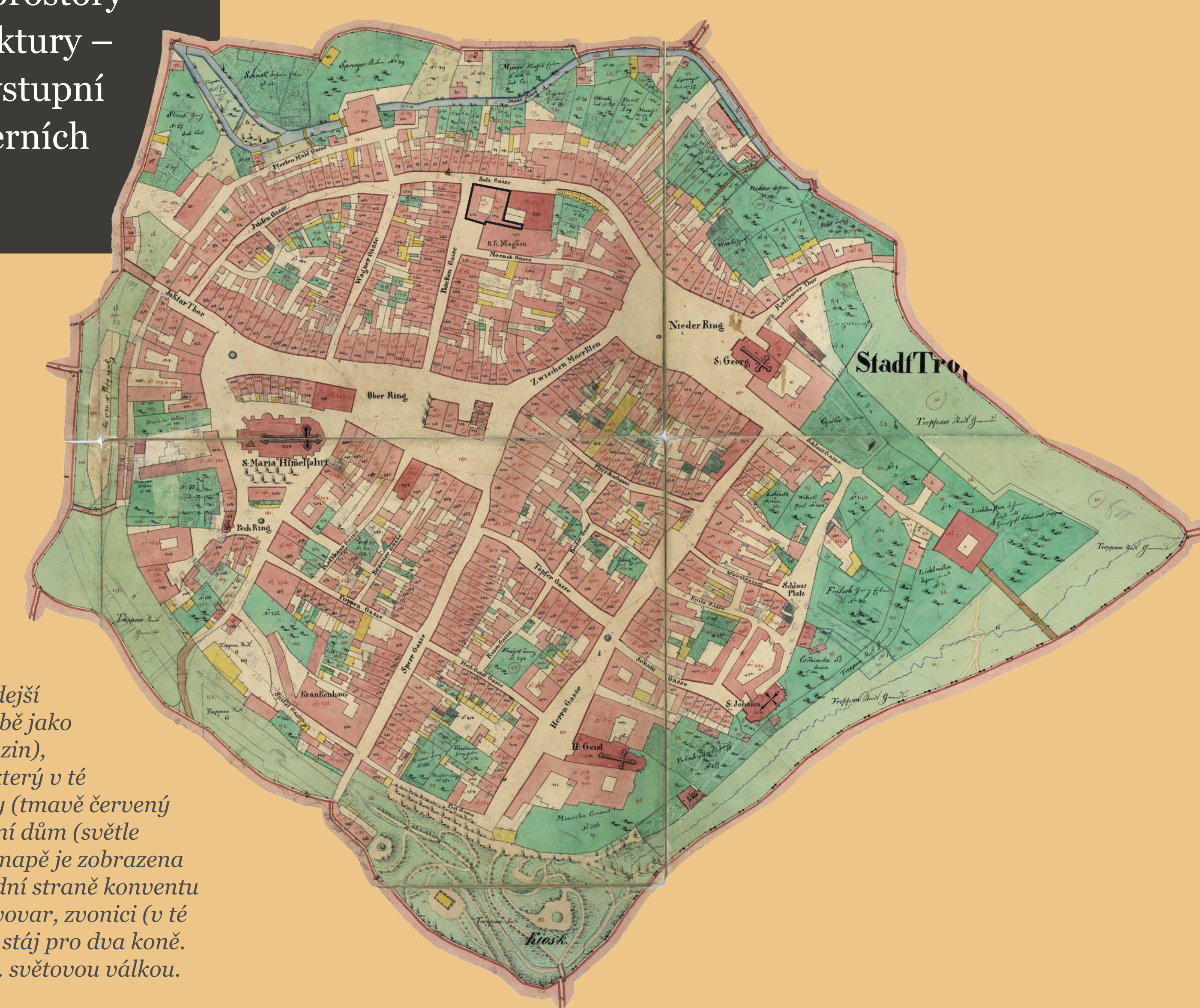
• Budovy někdejšího dominikánského kláštera na indikační skice stabilního katastru z roku 1836. Mapa stabilního katastru zobrazuje někdejší kostel sv. Václava, užíváný v té době jako skladiště (označen jako k. k. Magazin), a bývalý dominikánský konvent, který v té době sloužil potřebám hlavní školy (tmavě červený objekt s číslem 119b) a jako nájemní dům (světle červený objekt s číslem 119a). Na mapě je zobrazena i jednopatrová přístavba na západní straně konventu (číslo 119c), obsahující někdejší pivovar, zvonici (v té době již snesenou), úrtnici a také stáj pro dva koně. Tyto budovy zde stály ještě před 2. světovou válkou.