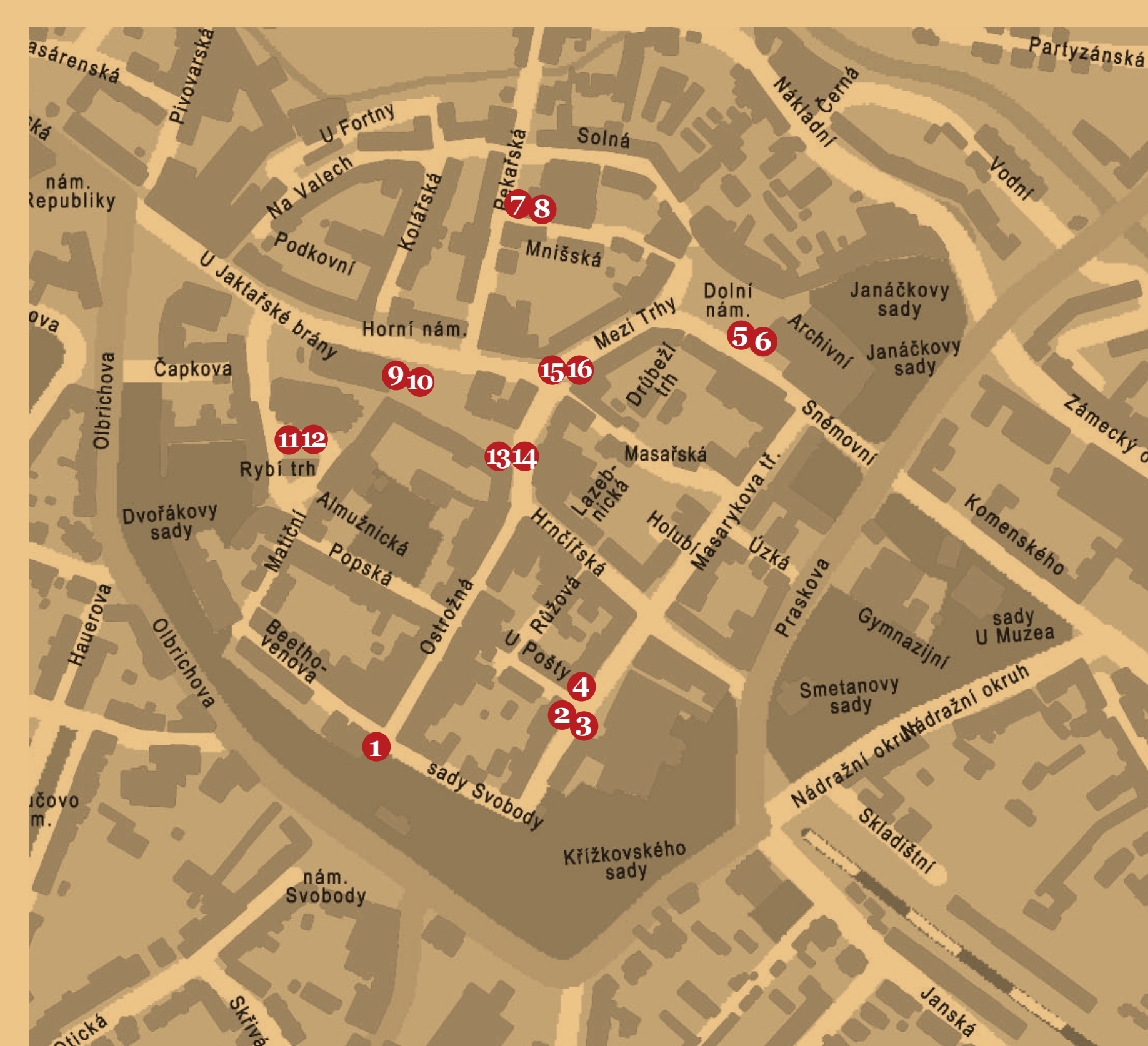
Letáčky s mapkou k exteriérové výstavě „Místa paměti“ jsou k dispozici: - v Turistickém informačním centru Opava - na recepci Obecního domu a Domu umění - v expozici Cesta města www.opava-city.cz/opavskykongres