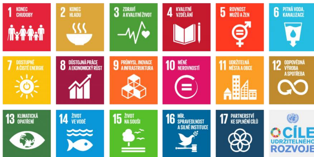
Obr. č. 1: Cíle udržitelného rozvoje. Dostupné z: https://www.tydenudrzitelnosti.cz/o-projektu/

Tyto cíle jsou dále rozpracovány tak, aby každý pochopil, jak může změnit své chování, jednání a uvažování a přispět tak k udržitelnému rozvoji.